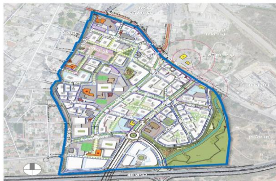
**הנושא ירד מסדר היום.

ישיבת המועצה מן המניין מס' 15-01.2024 מיום 22.01.2024