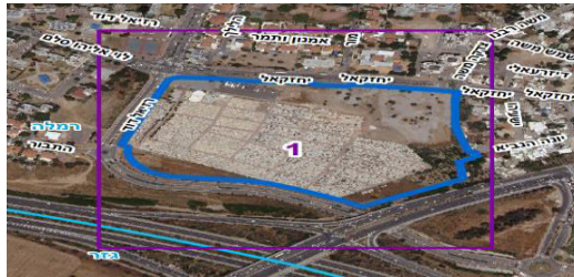
תשריט מצב מוצע

תשריטים מצורפים: תרשים סביבה (מתוך מצב מוצע)