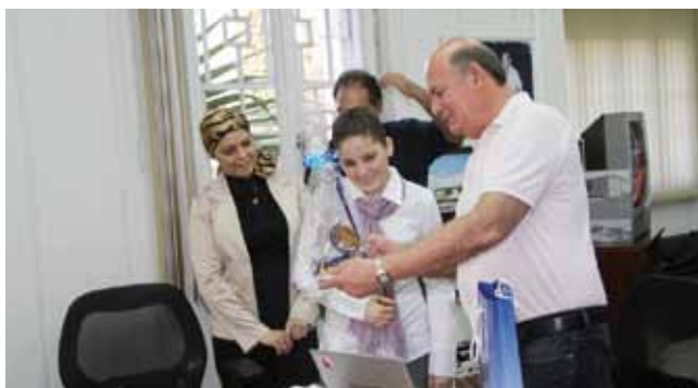
כבוד לנואמת הצעירה

יש כבוד. בית הספר היסודי "אלעומריה" ברמלה זכה בפרס שר החינוך ושר התחבורה והבטיחות בדרכים על פועלו לקידום ויישום תוכנית החינוך "נותנים כבוד בדרכים".