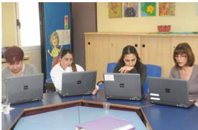
מחשב נייד לכל מורה

מתמטיקה בשילוב מחשב : בבית הספר בן גוריון לומדים זו השנה השלישית בשכבות ד', ה', ו' עם אל-נט, המאפשר תרגול והתקדמות בעבודה מול מחשב בבית הספר ובבית. במהלך 2010 הובלנו וזכינו לתעודות הצטיינות רבות ממנהלת התוכנית ברמה הארצית. בימים אלה נכנסת התוכנית לכל בתי הספר בעיר.