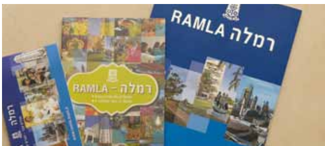
חברת תדמית חדשה

משפחתונים רשת המתנ"ס מפעילה 16 משפחתונים עצמאיים המעניקים שירות לכ-80 ילדים.