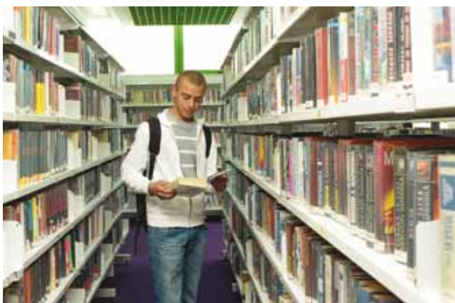
סיפור הצלחה. ספריית בלפר

הותקנו "לוחות חכמים" , המאפשרים להציג לתלמידים תמונות ואמצעי המחשה מלהיבים בנגיעת אצבע.