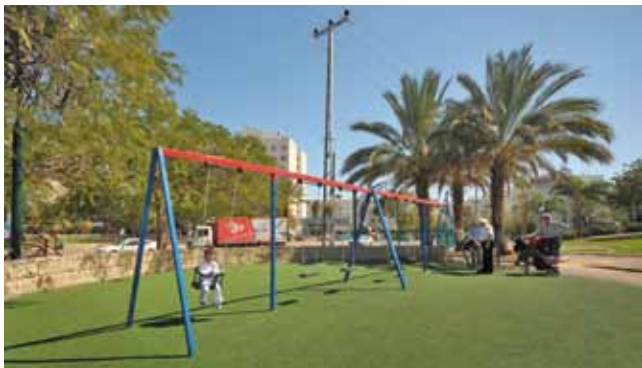
שדרוג גנים ציבוריים

השנה השלימה העירייה למעלה מעשרה פרויקטים לשדרוג והקמת מגרשי משחקים בגנים ציבוריים ברחבי העיר בהשקעה של למעלה מ-2.25 מיליון ₪. בין היתר כללו הפרויקטים הקמתם של מתקני משחקים על משטחי גומי בפארק עופר, בגן ציבורי האילנות בשכונת נווה דוד, בגן ההגנה, בגן ספיר, בגן טיילת בן גוריון, בגן אהרון בוגנים ובגן בריל. במסגרת השיפוץ הרחב שבוצע בגן גולדה, חודשו שבילי הגן, ניטעו כ-180 עצי צל, הוקמו סככות הצללה, הותקנו מתקני כושר חדשים ומודרניים המשמשים את תושבי העיר העוסקים בספורט ופיתוח הכושר הגופני, שוקמה התאורה ונשתלו למעלה מ-10 דונם של דשא. בגן שבזי הוסדרו שבילי הגן, הוקמו ברזיות לשתיה, ספסלים ומשטחי דשא, שוקמה התאורה והוקם מתקן משחקים מודרני. המשך ביצוע הפארק המרכזי בשכונת האומנים. עלות מוערכת: כ-15 מיליון ₪.