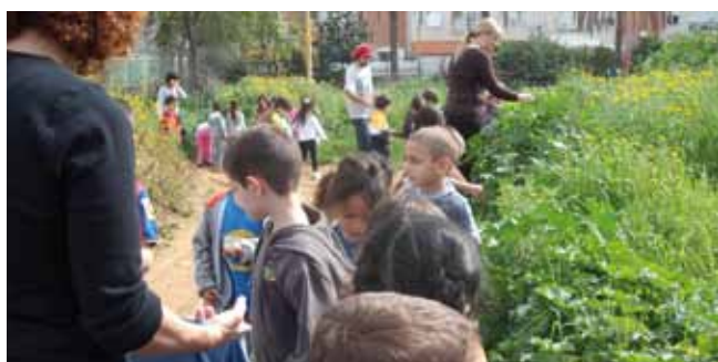
מנקים את השכונה

ממגרים את הגראפיטי. בני נוער, במערכת הפורמלית והבלתי פורמלית, שותפים פעילים בטיפוח פינות בעיר ובציור על קירות. התלמידים מסייעים במיגור תופעת הגראפיטי, בשיפור חזות פני העיר ומשפיעים על סביבת מגוריהם, במסגרת תוכנית 'עיר ללא אלימות'.