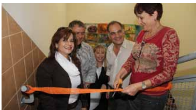
חונכים מטבח חדש בביה"ס סיני

שדרוג אולם הספורט בבית ספר נווה יונתן (ריצפת פרקט, סל חשמלי, ומיזוג). ביצוע עבודות זיפות בשני מוסדות חינוך. התקנת מזגנים חדשים בבתי הספר ובגנים בעלות של למעלה מחצי מיליון ₪. הקמת כיתות אקוסטיות בעיר לילדים עם צרכים מיוחדים. החלפת גג אסבסט של אולם הספורט בתיכון רמלוד. ריהוט בתי-הספר אופק, בר-אילן, אריאל והרי"ן, שהורחבו השנה עד לכיתות ז', כחלק ממהלך השינוי בחיטוב בעיר. הריהוט כלל הצטיידות במחשבים ומדעים המתאים לכיתות הבוגרות.