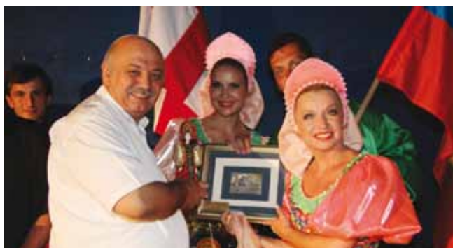
מארחים קבוצות מחו"ל

הקונסרבטוריון העירוני מציע לימודי נגינה במגוון כלי נגינה על ידי מורים מוסמכים ואף מפעיל הרכבי נגינה שונים ותזמורת נוער עירונית, המייצגת את העיר בהופעות באירועים שונים בעיר ובארץ.