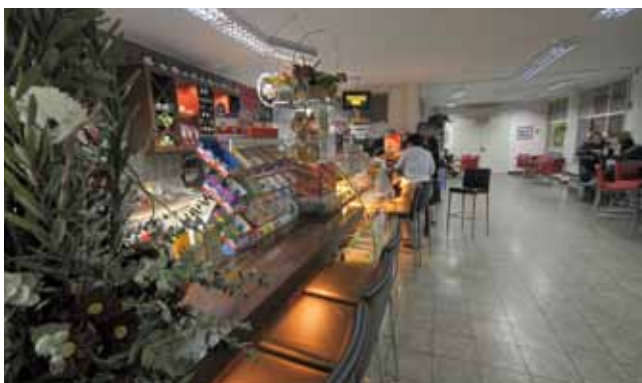
קפיטרייה חדשה. קמפוס השפלה

היחידה ללימודי השתלמויות והדרכות ארגוניות. גמולי השתלמות לעובדי המגזר הציבורי.