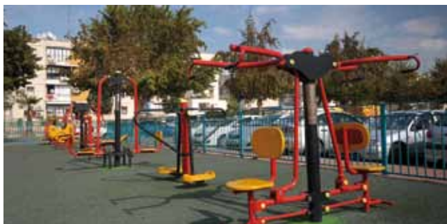
מתקני כושר פארק עופר

בשנים האחרונות הוכפלה פעילות הספורט בעיר והתקיימו בה שורה ארוכה של אירועים עממיים ותחרותיים, באמצעות מחלקת הספורט העירונית. כל זאת, תוך עידוד אורח חיים בריא וספורטיבי וטיפול ספורטאים מצטיינים. את רוחה הספורטיבית של העיר מובילים הישגיה של אליצור רמלה , המשחקת בליגת העל לנשים למעלה מעשור וקטפה שבע אליפויות ושלושה גביעי מדינה, ו מרכז הטניס ברמלה , הנחשב לאחד הפעילים והמצליחים בארץ, שרשם 13 אליפויות ושמונה גביעי מדינה.