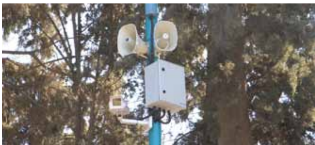
מצלמות ומערכות כריזה

גנרטור חירום. העירייה התקינה גנרטור חירום במרכז התקשורת העירוני, לצורך הפעלת רדיו 'קול רמלה' למתן הודעות ומידע לציבור בזמן חירום