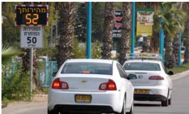
נלחמים בתאונות הדרכים

העירייה נוקטת לאורך כל השנה בפעולות חינוכיות בבתי הספר ובמרכז ההדרכה העירוני לבטיחות בדרכים, להגברת המודעות והחינוך להתנהגות זהירה וחכמה בדרכים. זאת, מתוך חזונה להיות הרשות המקומית הבטוחה ביותר לתושביה ולכל הבאים בשעריה.