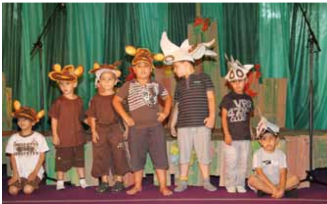
מסיפור לתיאטרון הספרייה העירונית

חוגים במגוון תחומים, ממחשבים, קריאה, שיעורי עזר באנגלית ועד התעמלות. פעילויות חינוך בשילוב כל בתי הספר בעיר, כמו "מצעד הספרים" ושבוע הספר.