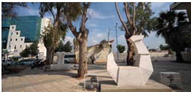
פיסול ופינת ישיבה. רחוב הרצל

החלפת מדי המים. התאגיד החל להחליף את מדי המים הישנים בעיר בסוף שנת 2009 ובמהלך כל שנת 2010. מדובר במבצע רחב היקף, במסגרתו הוחלפו למעלה מ-5,000 מדי מים ברחבי העיר שיאפשרו לתאגיד ולתושבים לקבל מדידה מדויקת, אמינה ואיכותית של צריכת המים הביתית.