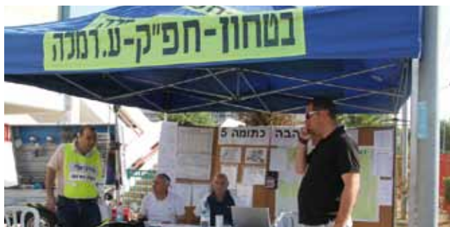
מתרגלים מוכנות לחירום

מחלקת הביטחון ברמלה רואה עצמה כנושאת הדגל בכל תחומי הביטחון והמוכנות לחירום ומשמשת מודל לחיקוי במספר רב של רשויות. בין הפעילויות שבוצעו במהלך שנת 2010 לשיפור תחומי הביטחון והמוכנות לחירום: