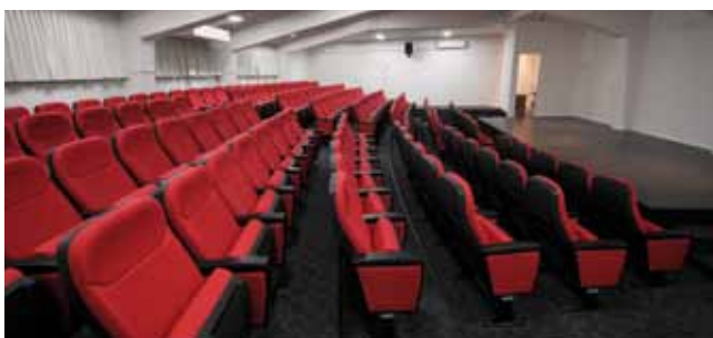
אודיטוריום חדש. קמפוס השפלה

380 סטודנטים קיבלו מלגות אקדמיה (מלגות עיריית רמלה + מלגות לחיילים משוחררים) • 90 איש קיבלו מלגות להכשרה מקצועית והשלמת השכלה (מלגות שיקום שכונות, מלגות לחיילים משוחררים וואצ'רים)