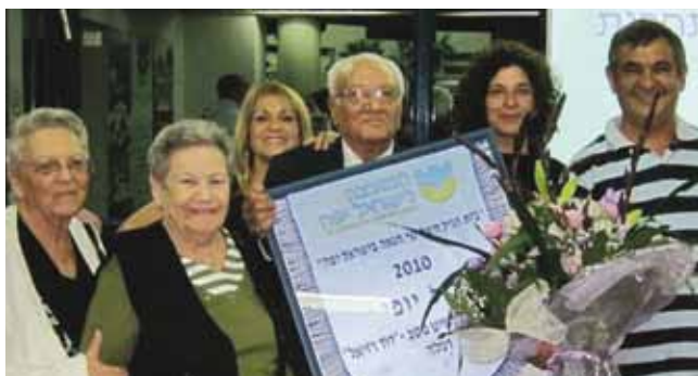
מרכז יום לקשיש. פרס יופי

עיריית רמלה עושה כל שביכולתה כדי לאפשר לכלל תושבי העיר לחיות בכבוד ובאיכות חיים. הדאגה לאוכלוסייה במצוקה ובסיכון, היא ערך עליון בקביעת אופייה המוסרי והערכי של קהילה. רמלה מאמינה בכיבוד השונה ופועלת בשורה של פרויקטים ופעילויות תמיכה, טיפול, הדרכה ועזרה למשפחות ויחידים הזקוקים לכך.