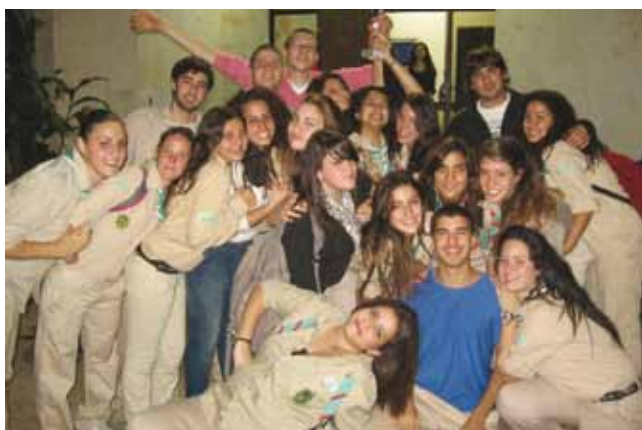
שבט אחווה רמלה

בעיר רמלה פועלים שישה מועדוני נוער המשרתים 350 ילדים ובני נוער וארבע תנועות נוער: צופים (שבט אחווה), צופי שב"א (שבט אחים), בני עקיבא והנוער העובד והלומד