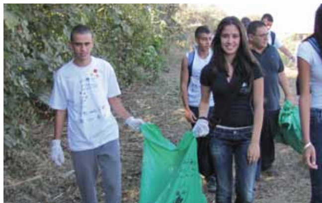
מנקים מכל הלב

מדור הדברה במחלקת התברואה עובד לפי תוכנית שנתית למניעת דגירת יתושים והתרבות מרססים. במקביל נותנים עובדי המדור, מדי יום, מענה נקודתי לפניות תושבים, לרבות טיפול בדבורים. בחופשת הקיץ מרססים כנגד חרקים בכל מוסדות החינוך העירוניים. במקרה של נחש, יש לפנות למוקד העירוני ולהזמין לוכד מקצועי.