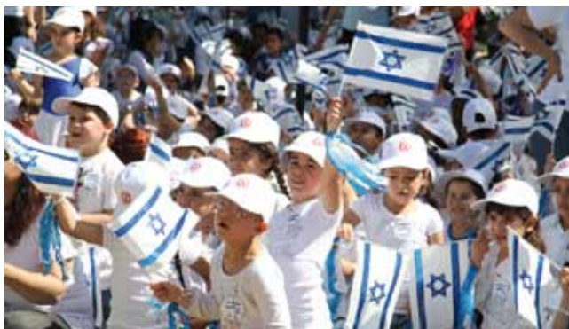
ילדים זה שמחה

נבדקו וטופלו ליקויי הבטיחות בכל מגרשי הספורט העירוניים ובתוך מוסדות החינוך.