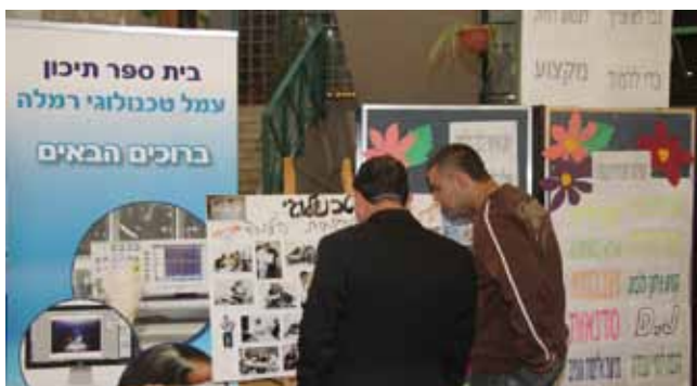
חינוך לאיכות הסביבה. ביה"ס עמל

פרס חינוך. בית הספר היסודי "בן צבי" מועמד לפרס חינוך מטעם מחוז מרכז. אנחנו מאחלים לבית הספר לזכות בפרס ולייצג אותנו ברמה הלאומית. ראשונים באיכות הסביבה. לשכת מנתחי מערכות מידע בישראל העניקו פרס ראשון לתלמידי שכבה ה' בבית ספר אופק. הפרס הוענק להם בתחרות פרויקטים ממוחשבים לבתי ספר יסודיים לשנת 2010, על הכנת מצגת בנושא מחזור ואיכות הסביבה.