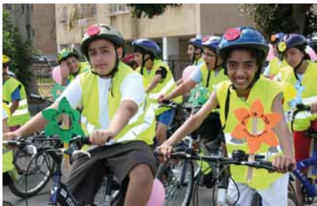
מסע אופניים. רכיבה נכונה

מערכות להצגת מהירויות הנסיעה של הרכבים הותקנו בארבעה רחובות: בן גוריון, קריית, א.ס. לוי ויחזקאל. העלות: כ-150 אלף ₪. הצגות ופעילויות נערכו בגני הילדים.