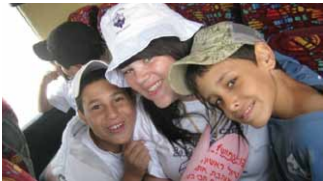
צלם, עושים כאן שמח

מועדון קול המוזיקה. יחידת הנוער נותנת במה לנוער חובב מוזיקה במופעי מוזיקה עירוניים: תחרויות כישרונות צעירים, ערב שירי לוחמים ומופעי קיץ.