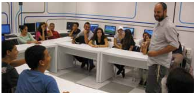
לימודי מחשב וטכנולוגיה, "נטע"

תוכנית "מעברים" , פרויקט של "שיקום והתחדשות העיר רמלה", מסייע לתלמידים במעבר מיסודי לחטיבת הביניים ולחטיבה העליונה.