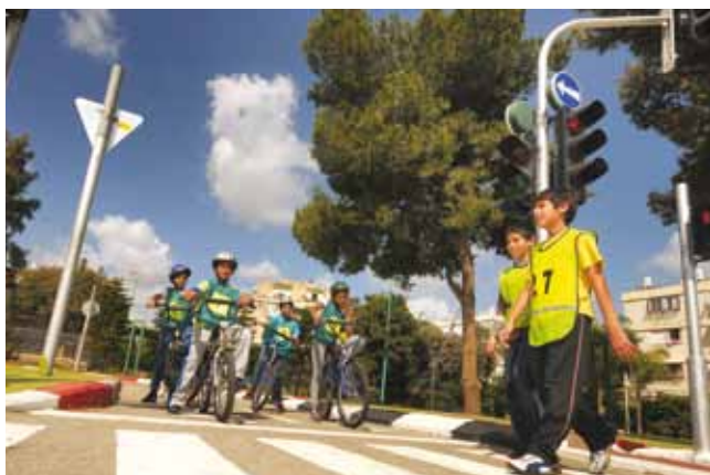
מרכז ההדרכה. אלפי תלמידים בשנה

"נוהגים אחרת" , תוכנית של הרשות הלאומית לבטיחות בדרכים, בשיתוף מתנ"ס אופק, עסקה בנושא בטיחות בדרכים באמצעות תיאטרון קהילתי. כ-15 בני נוער השתתפו בתהליך, נחשפו לעולם התיאטרון, למדו טכניקות משחק והעלו הצגה העוסקת בחיבור שבין נוער ונהיגה.