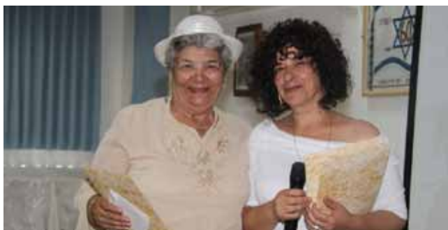
מכבדים את הקשיש