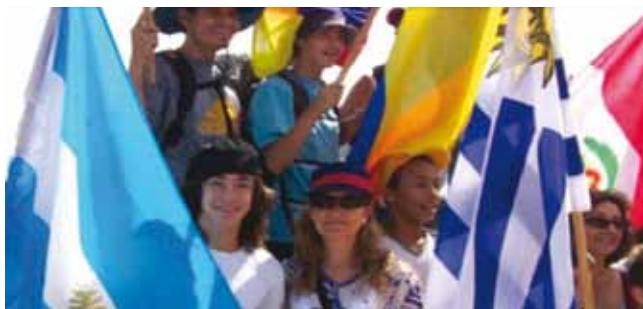
עליה מבורכת מדרום אמריקה