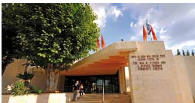
היכל התרבות. הצגות ומופעים בכל השנה

חגי ישראל. בכל אחד מהחגים נערכו במתנ"ס פעילויות לתושבים.