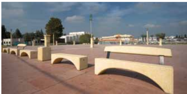
כיכר העיר. המגדל הלבן

שירות הלקוחות למים וביוב, הממוקם ברחוב מבצע משה 9 (מול בית ספר עמל) עבר למשכנו החדש ברחוב סוקולוב 21, בצמוד למשרדי התאגיד.