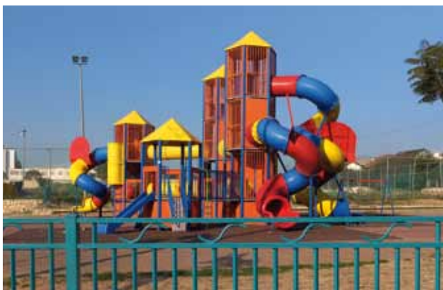
גן משחקים. ג'זאריש

סדנא לוועדי בתים: הרצאה מפי עו"ד על כוחם של ועדי בתים לשנות ולשפר את החיים בבית המשותף.