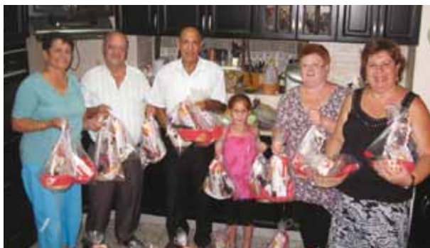
מתנדבים באהבה. רוטרי רמלה

37 מארגוני המתנדבים בעיר מאוגדים תחת קורת גג אחת הנקראת מועצת ארגוני המתנדבים - מאמ"ר וזאת לצורך איגום משאבים, תאום פעילויות ומתוך רצון לתת מענה לצרכים כלל עירוניים. הארגון מונה מאות מתנדבים ופועל בשיתוף פעולה מלא עם ארגונים של ותיקים ועולים, ערבים ויהודים, נוצרים ומוסלמים ובשיתוף רכזת מתנדבים עירונית.