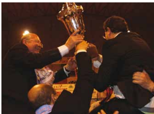
גביע אירופה לרמלה

ליגת שכונות בכדורגל מופעלת במגרשים משולבים ברחבי העיר ופועלת בשתי קטגוריות: 12 קבוצות בקטגוריית נערים, כיתות ז'-ח', 12 קבוצות בקטגוריית נוער, כיתות י', יא', יב'. הקבוצות מקיימות אימון שבועי ומשחק ליגה, שמנוהל על ידי שופטים בהתאם לתקנון.