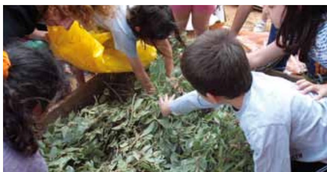
מלמדים לשמירת איכות הסביבה

סוללות. השנה הורחב מערך איסוף הסוללות והוצבו 40 מתקנים בבתי מרקחת, קופות חולים ומוסדות ציבוריים. זאת, בנוסף למתקנים הקיימים בבתי הספר.