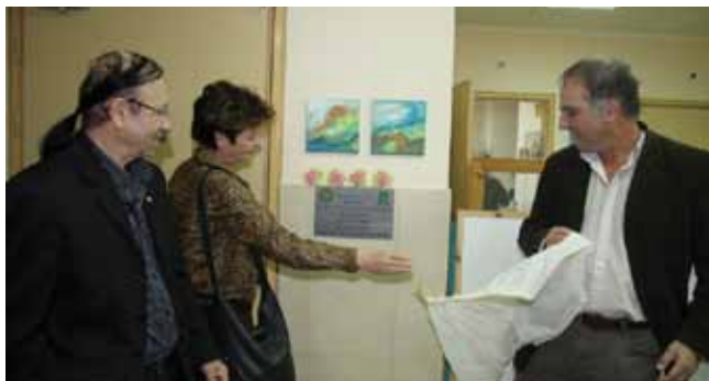
חונכים חדר הפעלה. לימן

תוכנית "קהילה נגישה" פועלת בשיתוף החברה למתנ"סים, משרד העבודה והרווחה, הרשות המקומית ופעילים בעלי צרכים מיוחדים. המטרה: לקדם את זכויות הנכים בקהילה: ייזום, פיתוח, נגישות, מתן מידע על זכויות וביצוע תוכניות בהתאם.