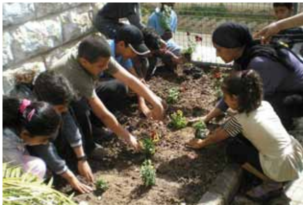
מטפחים את גינת ביה"ס

עיריית רמלה המשיכה גם בשנת 2010 לפעול במספר מישורים כדי לשפר את איכות החיים בעיר. לצד שמירה על עיר נקייה, שיפור איכות האוויר והגברת המחזור, פעלה העירייה בשורה של פרויקטים חינוכיים, פיקוח על מפעלים, מניעת רעש וקרינה ובריאות הציבור.