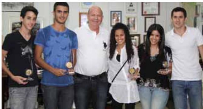
זמים צעירים מקום ראשון בארץ

הורות לקראת כיתה א' היא תוכנית המציעה סדנאות להורים לילדים העולים לכיתה א', על ידי "פרויקט שיקום והתחדשות העיר רמלה".