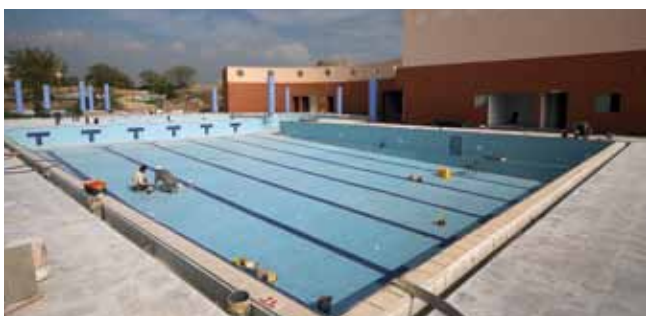
בריכה עירונית מודרנית

בריכה עירונית. הושלמה בנייתה של הבריכה העירונית החדשה שתפתח כבר בקיץ הקרוב. הבריכה כוללת בריכת שחייה חצי אולימפית, בריכת פעוטות ועוד.