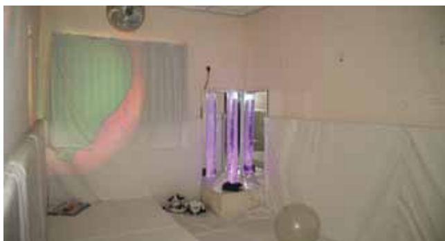
חדר טיפולים מיוחד. לימן