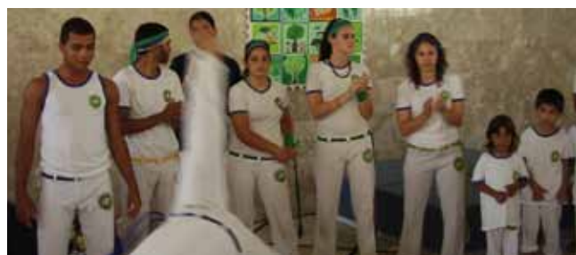
קאפווארה. שלל חוגים ופעילויות

משחקייה לפיתוח יכולת משחק משותפת, בשילוב משחקים דידיקטיים - לבני 3-6 והוריהם.