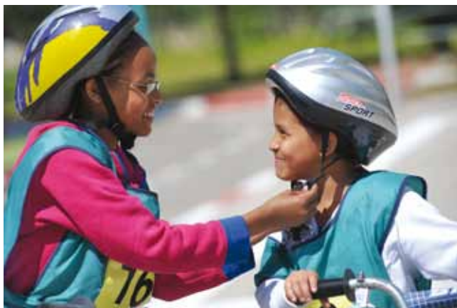
מרכז ההדרכה. תרגול והתנסות