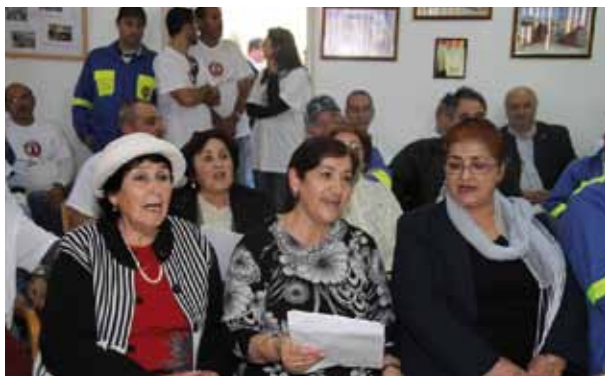
ט"ו בשבט. מתנ"ס קרית מנחם בגין