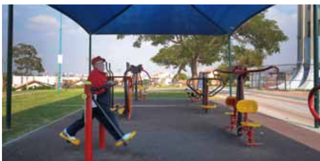
מתקני כושר והצללה. גן גולדה

תאגיד המים רמלה הוקם על ידי העירייה כדי לקדם תהליכי התייעלות ולהעלות את רמת הביצוע והשירות בתחום אספקת שירותי המים והביוב. החלפת צנרת ביוב. התאגיד בשיתוף עיריית רמלה ביצע החלפת 1 ק"מ של צנרת ביוב ברחובות בר אילן-ויצמן. ובכך יושלם כמעט סופית נושא הזרמת שפכי הביוב מהעיר לכיוון מכון השאיבה המרכזי. עלות הפרויקט להחלפת צנרת הביוב והניקוז: כ-6 מיליון ₪.