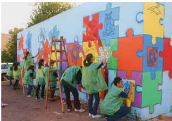
מציירים ומעצבים קירות

מפגשי קבוצות פעילים. היחידה לאיכות הסביבה מקיימת תוכנית ייחודית, בסיוע המשרד להגנת הסביבה, בה קבוצות תושבים פעילים מקבלות הנחיה מקצועית ותקציב לביצוע פרויקט לקידום המחזור בעיר. בשנת 2010 החלו לפעול ארבע קבוצות מבוגרים וקבוצת נוער אחת. הפרויקט יבוצע בשנת 2011.