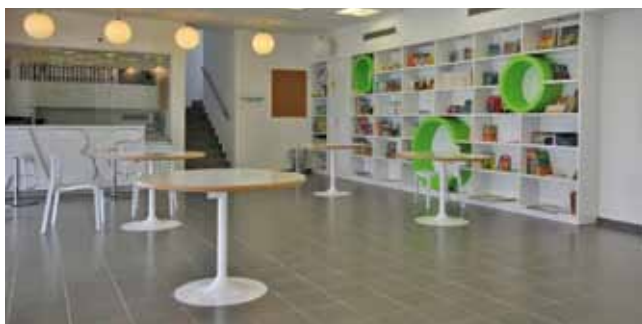
סביבת לימודים מודרנית

תוכנית תה"ל לתגבור לימודי במקצועות לבחינות הבגרות. לשם הפעלת התוכנית בשנת הלימודים תשע"א הוקצו על ידי העירייה ומשרד החינוך 2,190,000 ₪. כמו כן תוגברו תלמידי כיתות י' שאינם כלולים במסגרת התוכנית המקורית.