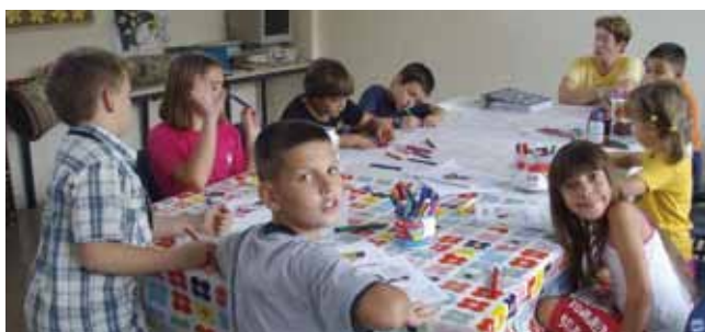
חוגים וכיף לילדי העולים

עיריית רמלה, באמצעות יחידת הקליטה העירונית, מודעת וערוכה לקליטת כל עולה חדש המגיע לעיר במסגרת הסוכנות היהודית ומכינה תוכנית קליטה פרטנית לכל משפחה. גם השנה, קיבלו העולים החדשים ליווי בצעדיהם הראשונים: פתיחת חשבון בנק, סיוע באמצעות רכזי קליטה דוברי השפה בתחומי תעסוקה, תרגום מסמכים, ליווי מול מוסדות ומתן הטבות עירוניות שונות.