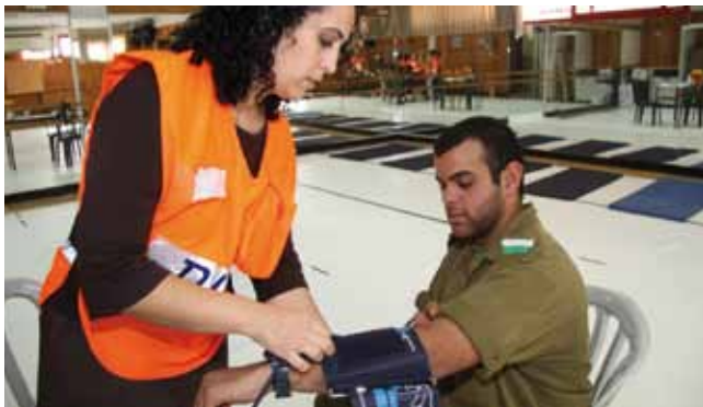
מתרגלים אירוע ביולוגי

תרגיל העורף הלאומי "נקודת מפנה 4" התקיים, ובמסגרתו תורגל תרחיש של נפילת טיל בעיר. במהלך התרגיל הוקפץ החפ"ק העירוני למקום האירוע. התרגיל נוהל בראשות ראש העירייה ממרכז ההפעלה העירוני. בביקורת שניתנה מנציגי פיקוד העורף צוינו לשבח השתתפותו וניהולו של ראש העירייה ושיתוף הפעולה בין מחלקות העירייה.