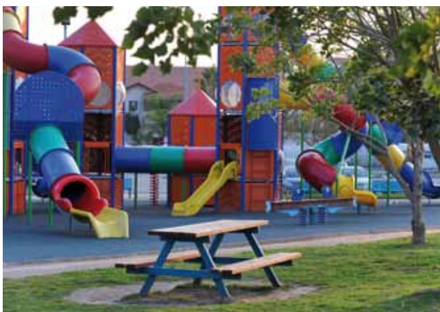
מתקני משחקים. פארק עופר

שבע שכונות חדשות בעלות שטחים פתוחים וירוקים המתוכננות בסטנדרט מגורים גבוה נבנו בעיר בשנים האחרונות: גני דן, נווה בניין, רמת דן, נווה דוד החדשה, קריית מנחם בגין, יובלים וקריית האומנים. באמצעות אגף ההנדסה פיתוח ותשתיות, נמשכה גם השנה תנופת הבנייה אליה הצטרפו גם שירותי קהילה מודרניים, מוסדות חינוך חדשים, בתי ספר, גני ילדים, מרפאות, מרכזיים קהילתיים, גנים ציבוריים, גני משחקים ומתקנים לילדים. מבנים רבים שופצו, שודרגו, הורחבו ועוצבו מחדש ונסללו כבישים, מדרכות וכיכרות.