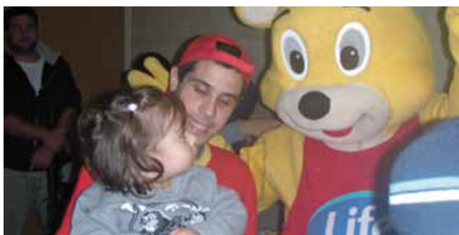
פעילות לילדי המתנס"ים

רשת המתנס"ים בעיר הינה גוף רב-משימתי ורב-גילאי, המפעיל תוכניות מגוונות, המיועדות לכלל האוכלוסייה. הרשת רואה בביסוס חיי קהילה וחברה בעיר את האתגר המרכזי של פעילותה. הרשת מורכבת משבע שלוחות מתנס"ים הפזורות בעיר, אגף לגיל הרך הכולל שלושה מעונות יום, 15 משפחתונים צהרונים ומרכז העשרה לגיל הרך.