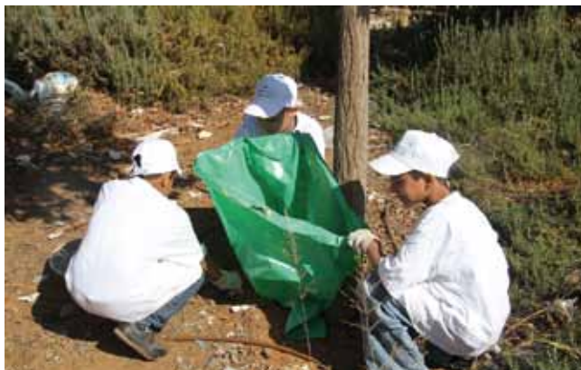
מנקים את הסביבה

עיריית רמלה, בשיתוף המשרד להגנת הסביבה, פועלת למניעת השלכת פסולת בנייה בשטחים שבתחומה. בשנת 2010 הפעילה העירייה ניידת מיוחדת במטרה לאכוף את החוק ולשמש גורם מרתיע למשליכי פסולת. בעקבות הפעלת הניידת נמנעה השלכת פסולת במקומות רבים בעיר והוגשו 20 תביעות משפטיות, על פי חוק שמירת הניקיון.