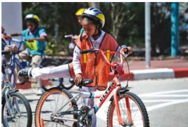
התנהגות נכונה ובטוחה בדרכים

הופקה תוכנית טלוויזיה מיוחדת בנושא זהירות בדרכים, מרכז הדרכה, דגשים להתנהגות נכונה בכבישים וראיונות עם אנשי מקצוע. התוכנית הופקה ע"י הטלוויזיה הקהילתית - מרכז התקשורת העירונית, בשיתוף הרשות הלאומית לבטיחות בדרכים.