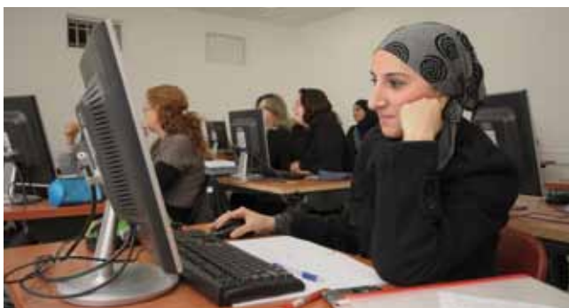
כיתות ממוחשבות. קמפוס השפלה

מרכז קשתות, מרכז הצעירים ופיתוח ההון האנושי של העיר, נותן יעוץ והכוונה לצעירים תושבי רמלה בנושאי לימודים אקדמיים, יזמות עסקית, מלגות, הלוואות, הכשרה מקצועית, תעסוקה וקריירה, מעורבות חברתית, מנהיגות, תרבות הפנאי ועוד. לפנייה דרך המייל: merkazt@ramla.muni.il לפניה דרך אתר האינטרנט: www.kshatot.co.il