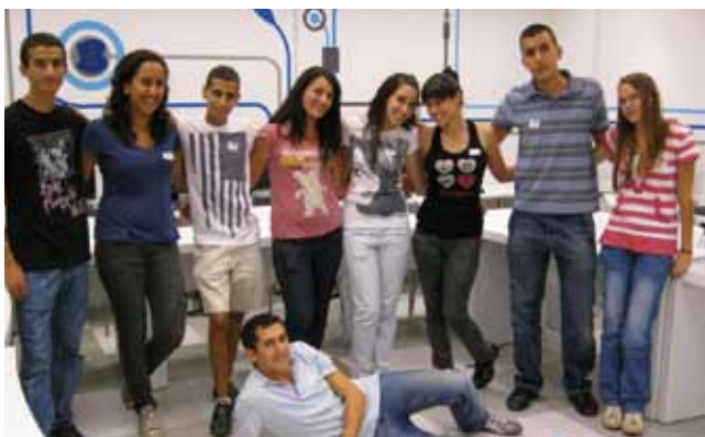
צעירי נטע רמלה

סטנד אפ. במהלך חודשי הקיץ התקיימו בהיכל התרבות ערבי תרבות ייחודיים של צחוק ומופעי "סטנד אפ חצות", במחיר מסובסד וסמלי של 35 ₪ בלבד.