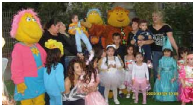
פורים שמח בצהרונים

משפחתונים רשת המתנ"ס מפעילה 16 משפחתונים עצמאיים המעניקים שירות לכ-80 ילדים.