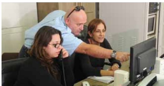
מענה בזמן אמת. המוקד העירוני

ל-60 המצלמות שהותקנו בעיר במסגרת התוכנית עיר ללא אלימות , התווספו 25 מצלמות בטכנולוגיה מתקדמת. המצלמות מחוברות למוקד העירוני ומאפשרות צפייה רצופה של המוקדנים באתרים שונים ברחבי העיר. בנוסף הותקנו מספר מערכות כריזה בחלק מהאתרים, המאפשרות למוקדנים להעביר מסרים מידיים במקרים של ונדליזם והתקהלויות לא רצויות.