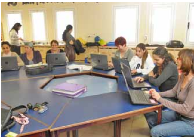
חדר מורים ממוחשב

בימים אלו עוברת מערכת החינוך העירונית מהפכה ממשית בתחום המחשוב במגמה ליישם סביבות לימודים והוראה ב"כיתות חכמות", המתקדמות באמצעים טכנולוגיים: