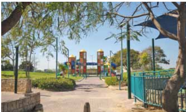
פיתוח, גינון ומתקני משחקים

עיריית רמלה השלימה את שיקום רחוב קלאוזנר בהשקעה של 1.2 מיליון ₪ ובימים אלה מסיימת את שדרוגם ושיקומם של חלקים מכבישי הרחובות שבזי, וילנא, צומת שמשון הגיבור, יהודה שטיין, אבא אחימאיר והשומר בהשקעה של 1.2 מיליון ₪.