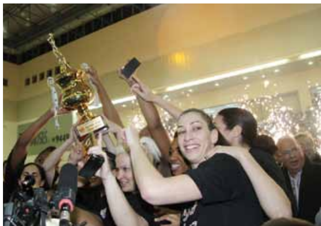
גביע המדינה לרמלה