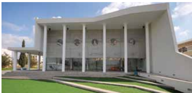
מרכז YRF ללימודי אנגלית

תוכנית רצפים בחינוך יצאה לדרך לאחר תקופת הכשרה של אנשי חינוך. במסגרת התוכנית נפגשים אנשי החינוך ב-13 מוקדים בעיר סביב נושאים שונים, כמו מתמטיקה, אנגלית, אקלים מוסדי ועוד. כל נושא מובל על ידי אחד ממנהלי בתי הספר. התוכנית הפכה למודל נלמד במחוז מרכז.