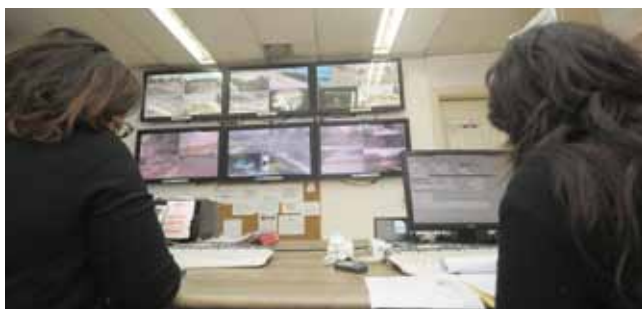
מצלמות המוקד העירוני

עיריית רמלה פועלת ללא הרף להעלאת תחושת המוגנות ולשמירה על הביטחון והסדר הציבורי בעיר. הניידת המשולבת פועלת 24 שעות ביממה ויחד עם המוקד העירוני 108, הפיקוח העירוני ומחלקת ביטחון, מטפלת העירייה במפגעים ואוכפת ביעילות הפרות סדר העלולות לפגוע באיכות חיי התושבים.