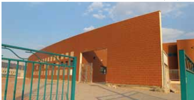
בית ספר האומנים

שיפוץ בניין בבית ספר אחווה בעלות של כמיליון וחצי ₪.