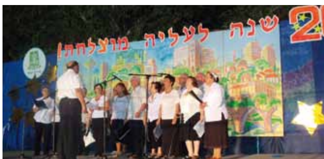
20 שנות עליה