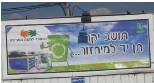
משתפים את הציבור

בשנת 2010 מחזרה רמלה כ-25 אחוז מסך הפסולת העירונית • ברחבי העיר פרושים מרכזי מחזור הכוללים מתקנים ייעודיים לקרטון, נייר עיתון ובקבוקי פלסטיק