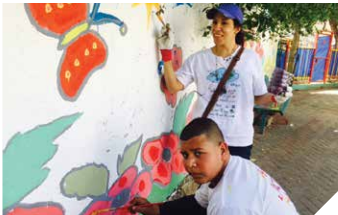
שומרים על איכות הסביבה

מתנדבים פעילים למען הסביבה הוסמכו כ"נאמני סביבה" ומקדמים פרויקטים בעיר, בעיקר בתחום המחזור והניקיון. הקבוצה מזמינה תושבים נוספים להצטרף. קבוצת מנהיגים קהילתיים ערבים מתנדבים, פועלת גם בתחום איכות הסביבה, לקידום מודעות מחזור בקרב התושבים, מעורבות בני נוער, טיפוח סביבה ועוד.