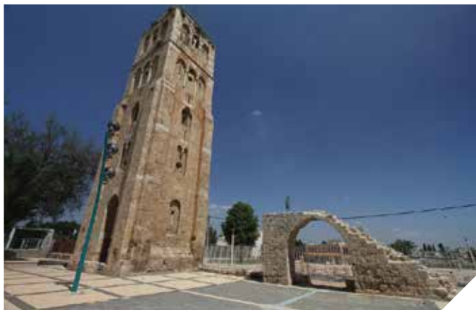
המגדל הלבן. אתרים היסטוריים יחודיים

העירייה משקיעה משאבים רבים ויצירת סל שרותים מגוון ומקצועי בכל תחומי החיים למען תושבי העיר. קבלו על קצה המזלג את עיקרי תוכנית החומש העירונית, נתונים דמוגרפים, היסטוריה, תקציב ועוד.