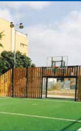
3 מגרשי מיני פיץ' ומתקני ספורט