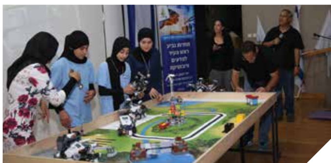
גביע ראש העיר ברובוטיקה