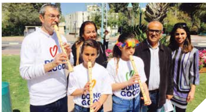
מעשים טובים כל השנה, גם למען הסביבה