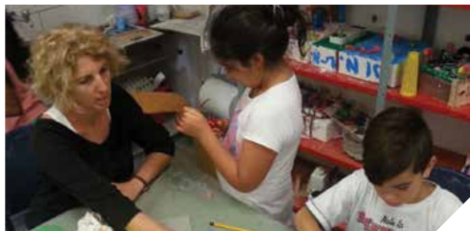
מלמדים ציור, משחק ויצירה

תוכנית הריתמוסיקה מופעלת בגני הילדים, תוך אינטגרציה של תנועה במרחב, משחק והבעה דרך שירה, נגינה, תמליל באלתור ויצירה. התוכנית מעשירה את הילדים וחושפת אותם לסגנונות מוסיקליים שונים, מפתחת את יכולת ההקשבה, מעלה את הביטחון העצמי ומפתחת את הדמיון והיכולת האינטואיטיבית של הגוף. רחוב ויצמן 9, 08-9232542 .