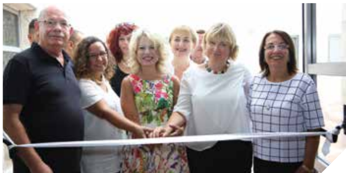
מחזקים את תשתיות מערכת החינוך

נבנה ונחנך אגף חדש בבית ספר תיכון שש שנתי למדעים ואומנויות ע"ש ביסטריצקי בקריית האומנים.