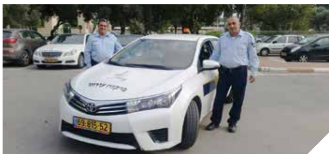
פיקוח ושיטור 24 שעות ביממה

עיריית רמלה פועלת ללא הרף להעלאת תחושת המוגנות ולשמירה ועל הסדר הציבורי בעיר באמצעות יחידת הפיקוח העירוני ויחידת השיטור העירוני בעיר פועלות שתי ניידות 24 שעות ביממה. יחד עם המוקד העירוני 108 מטפלת העירייה במפגעים ואוכפת בעילות הפרות סדר העלולות לפגוע באיכות חיי התושבים.