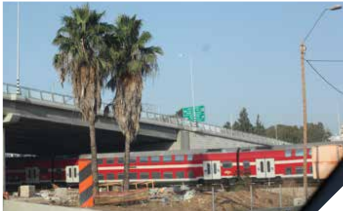
הפרדה מפלסית 208 יותר בטיחות וצמצום עומסי התנועה

חברת נתיבי ישראל פתחה לתנועה את ההפרדה המפלסית 208 בין כביש 44 ומסילת הרכבת על הציר המוביל לאזור התעשייה, שכונת קריית מנחם בגין והעיר לוד. בניית ההפרדה המפלסית היא חלק מתוכנית העירייה וחזון משרד התחבורה למניעת מפגשים בין כלי רכב ורכבות, צמצום עומסי התנועה ושיפור הבטיחות.