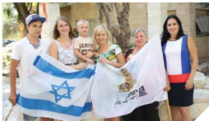
משלבים בחיי הקהילה

עיריית רמלה רואה בעולים החדשים הון אנושי המחזק את העיר ומפעילה למענם, יחד עם משרד הקליטה, הסוכנות היהודית וגורמים נוספים, פרויקטים רבים המעצימים את זהותם התרבותית ומקלים על השתלבותם בחיי הקהילה בעיר.