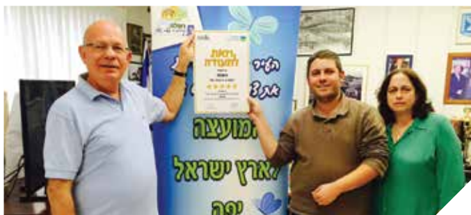
תעודת הוקרה לפעילות ענפה

המועצה לישראל יפה העניקה לרמלה 5 כוכבי יופי במסגרת התחרות השנתית לקריה יפה ומקיימת בישראל 2015. הענקת הפרס מהווה תעודת הכרה לפעילות הענפה של העירייה ואורגניה בתחום הקהילתי - סביבתי ומערכת החינוך העירונית.