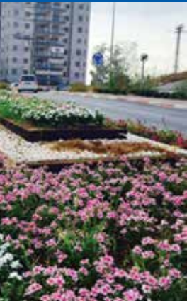
משדרגים את מערך הגינון בעיר