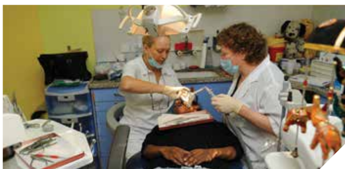
בריאות השן. אלפי מטופלים