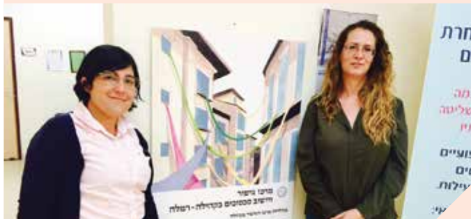
יוצרים דיאלוג והסכמות

מרכז גישור ויישוב סכסוכים בקהילה רמלה, הוקם במטרה ליצור תהליך שינוי חברתי ברמה עירונית, צמצום הקונפליקטים בחברה, תוך יצירת דיאלוג בקרב התושבים על ידי פעולות גישור, הסברה ומניעה. במהלך 2015, הופנו למרכז למעלה מ-100 פניות כשמתוכן 60 פניות מתוך הקהילה, שה"כ נהנו מקבלת שרות זה כ-200 איש באופן ישיר וכ-100 איש באופן עקיף. בין היתר עוסקים במרכז הגישור בבניית הסכמות לוועדי בתים ובעלי עסקים, הכשרות וקורסי גישור - 270 תושבים סיימו קורס גישור בסיסי וחלקם מתנדבים במסגרת המרכז, (18 קורסי גישור), "פרקטיקום" - התנסות מודרכת בגישור בתחום הקהילה (4 קורסים).