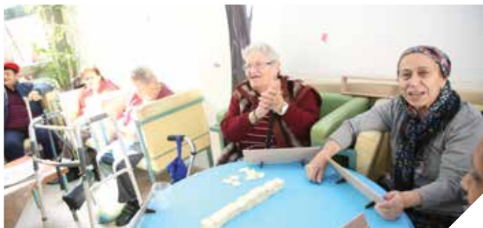
פעילות חברתית. משקיעים יותר באזרחים הותיקים

מהות המדור לטיפול באזרחים ותיקים היא הדאגה לרווחתם וחיזוקם במישור האישי, המשפחתי והקהילתי, תוך מיצוי זכויותיהם והשאתם בקהילה ובסביבה תומכת, שיודעת לספק מענה ומאפשרת להזדקן בכבוד. המדור מספק שירותים בבית, סידורים חוץ ביתיים ונופשוניים, מרכזי יום לזקן ופעילות במועדונים חברתיים.