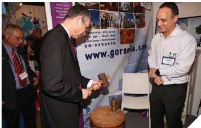
מטבעים מטבעות עם שר התיירות יריב לוי

מתי הטבעתם מטבע אמיתי במו ידיכם? האם ימיה הגדולים של העיר בה הוטבעו מטבעות זהב לשימוש במזרח התיכון לפני כאלף שנה ויותר חוזרים? מוזיאון רמלה התחדש במתקן להטבעת מטבעות בשיטה העתיקה עם פטיש ורושמה ממתכת ומטבעות נחושת. בקרו בעצמכם במוזיאון וגלו במו ידיכם.