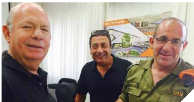
מקדמים את הבטחון

מחלקת הביטחון ברשות היא נושאת הדגל בין רשויות האזור בכל תחומי הביטחון והמוכנות לחירום ומשמשת מודל לחיקוי במספר רב של רשויות. המחלקה משקיעה מאמצים ומשאבים לשיפור תחושת הביטחון של התושבים וההיערכות לחירום.