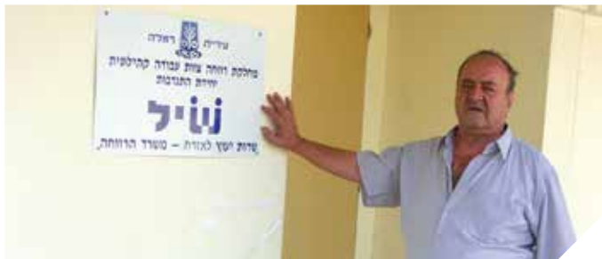
למען זכויות התושב

מרכז שירות ייעוץ לאזרח (שי"ל) מיידע את האזרח על זכויותיו וחובותיו בתחומים שונים ומגוונים. טלפקס. 08-9771835