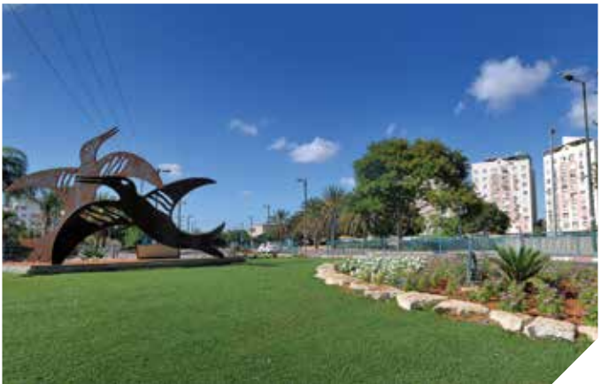
שכונות חדשות ופיתוח סביבתי. קריית מנחם בגין