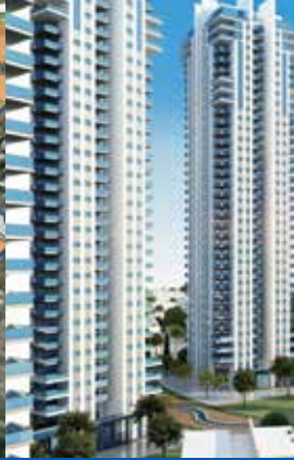
הסכמי הגג שכונת רמלה מערב החדשה