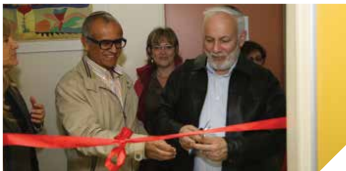
משקיעים בחינוך לגיל הרך

הרשת מפעילה שבע שלוחות מתנ"ס הפזורות בעיר, אגף לגיל הרך, מועדוני קשישים, פעילות לאוכלוסיות מיוחדות, תוכנית עמיתים, סל תרבות, טלוויזיה קהילתית ועוד שלל פעילויות ותוכניות המותאמות ומשתנות בהתאם לצרכי הקהילה.