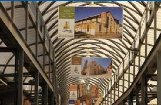
שוק מקורה ופעיל