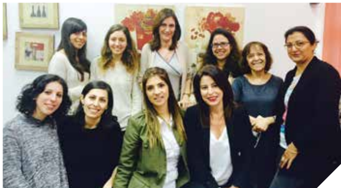
קמפוס השפלה. צוות מקצועי ומגוון רחב של תחומי לימוד

מרכז האוניברסיטה הפתוחה ברמלה מאפשר לתושבי העיר וסביבתה לימודים אקדמיים לתואר ראשון ושני, במוסד מוכר ויוקרתי, קרוב לבית, ללא תנאי קבלה וללא דמי מכללה, תוך קבלת סיוע ומלגות. לבחירתכם מסלולים חדשים במדעי החברה והרוח, המזרח התיכון, חינוך, פסיכולוגיה, כלכלה וניהול.