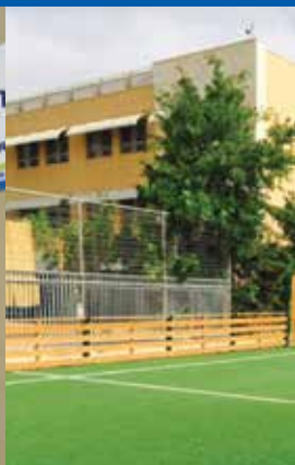
תחנה לכריאות המשפחה בן גוריון