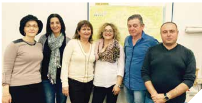
הזרוע הביצועית שמאחורי הקלעים