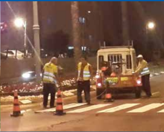
מתחזקים את כבישי העיר