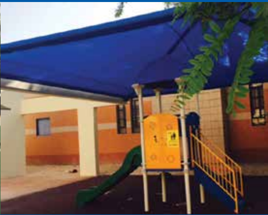
גני ילדים חדשים