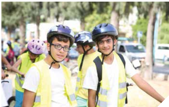
קסדה בראש טוב

יום המחויבות הארצי לבטיחות בדרכים התקיים השנה בחודש נובמבר ברחבי העיר, בין היתר בשוק העירוני, בקניון קריית הממשלה ובמוסדות החינוך, בנושא העלאת המודעות וחיזוק הצורך ללקיחת אחריות אישית במאבק בתאונות הדרכים, תוך מתן דגש על התנהגות הולכי הרגל וגילוי ערנות לחצייה בטוחה.