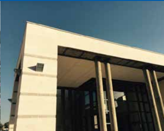
בית הכנסת החדש קריית האומנים