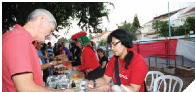
שומרים על המסורת 1. עולי פרו