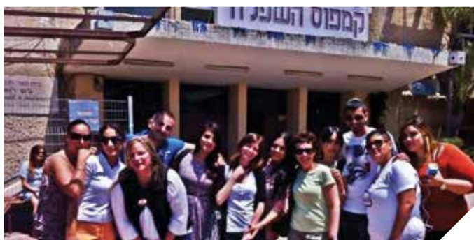
השכלה גבוהה ליד הבית