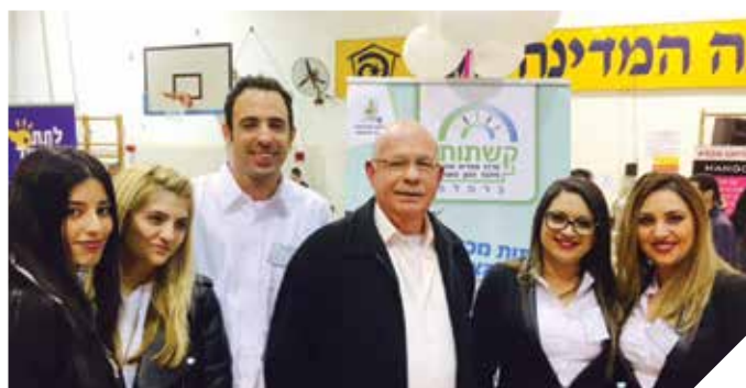
למען קידום הצעירים

2500 צעירים השתתפו בפעילויות בהן סדנאות, קורסים, טיולים מסיבות, ירידים ועוד. 1500 צעירים הגיעו לפגישות ייעוץ בתחומי פיתוח קריירה, השכלה, הכשרה מקצועית, תעסוקה ומעורבות חברתית. עשרות צעירים נוספים קיבלו שירות בטלפון, מייל ובפייסבוק.