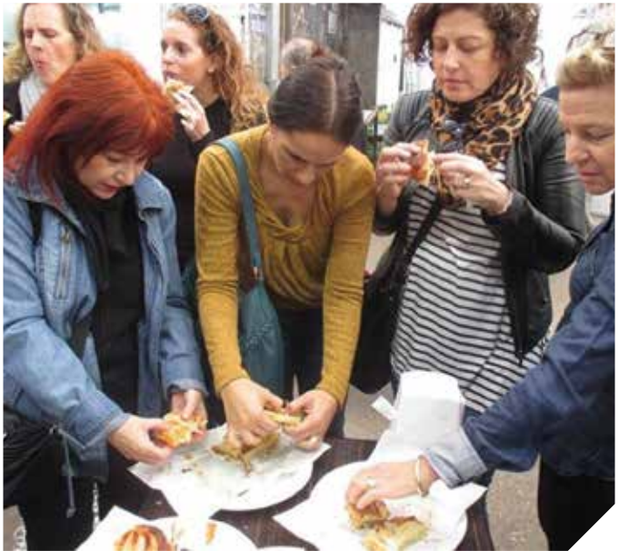
שוק רמלה. חוויה קולינארית

מה כבר לא נאמר על שוק רמלה, אבל עכשיו, גם לנו יש סיורי טעימות. עשרות קבוצות עברו השנה בשוק בליווי מדריך מטעם המוזיאון וחוו סיור טעימות בין הדוכנים השונים ובשיתוף פעולה עם וועד השוק.