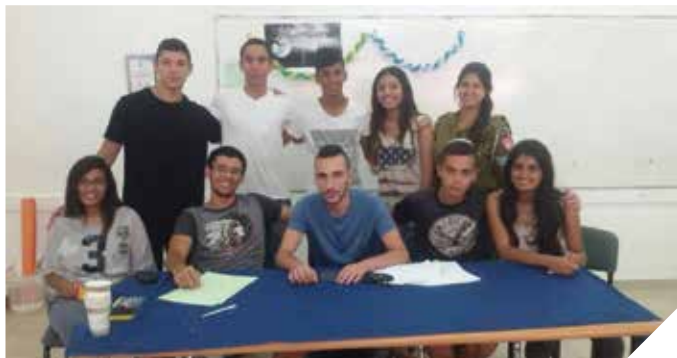
מועצת נוער פעילה. שותפים לעשייה העירונית

בחודש יולי השנה נפתחה 'עיר הנוער' במתחם פארק עופר והתקיימו בה פעילויות ומופעים לבני הנוער, מסיבות אוזניות, תחרויות ספורט לקבוצות וליחידים, והכול בניהולם ובהשגחתם של אנשי מקצוע.