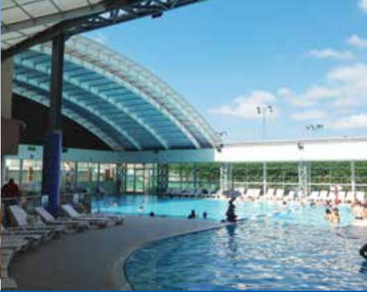
בריכה מקורה ומחוממת