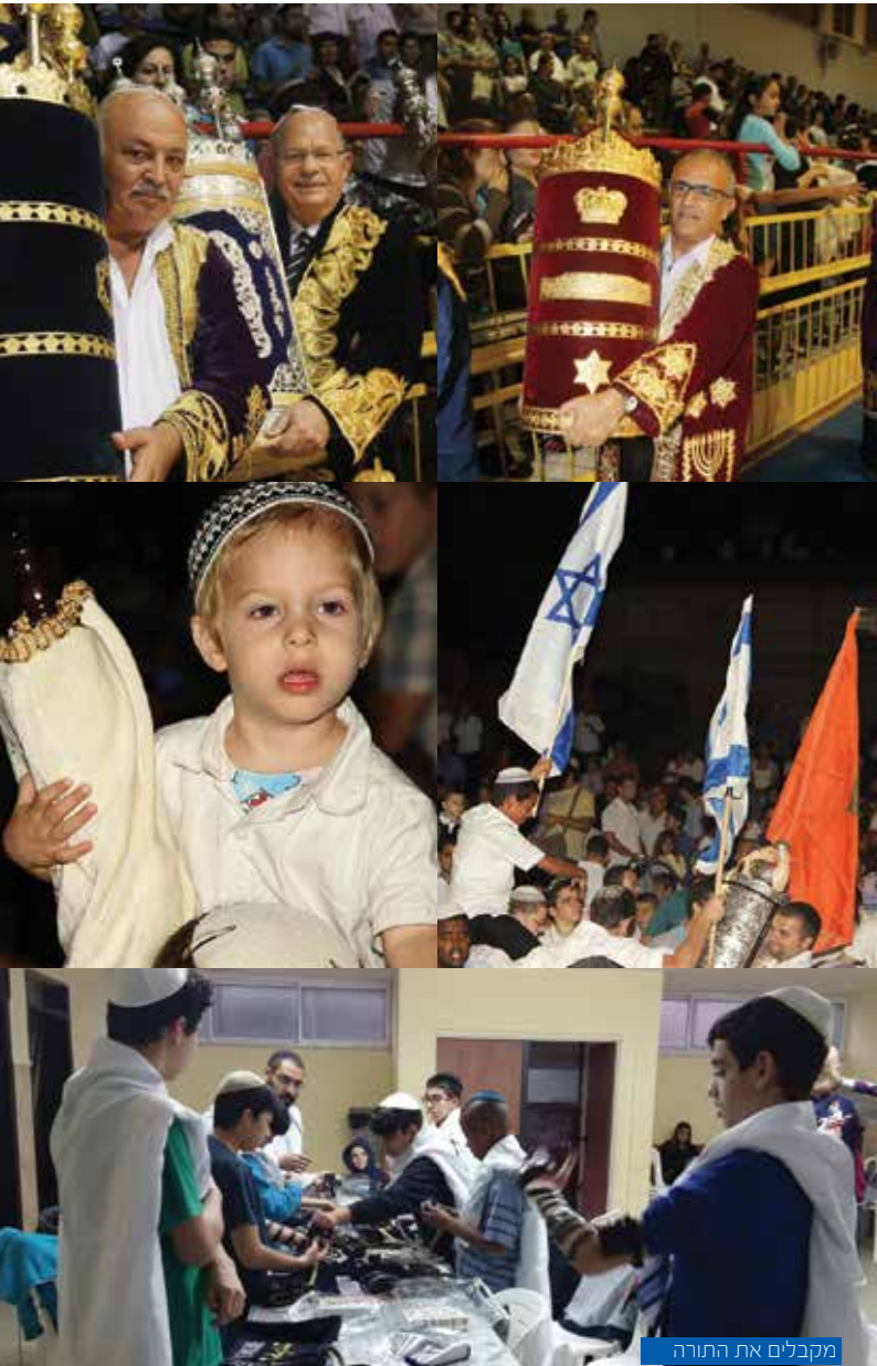
מקבלים את התורה

המדור פועל במהלך כל השנה בשורה ארוכה של אירועים בהם: הצגות, סיורים, הרצאות והפעלות ברוח ערכי היהדות לכל המשפחה בהשתתפות אלפי תושבים. בנוסף מפעיל המדור פרויקטים מיוחדים שביב מעגל השנה כמו הקפות שניות בשמחת תורה, הדלקת נרות חנוכה, קריאת מגילת אסתר, ליל סדר פסח מרכזי בארבעה מוקדים, במת יום העצמאות לשומרי מסורת, צעדת ריקודגלים ביום ירושלים, פרויקט בר מצווה עירוני, שבת עולמית, מעמד הקהל עירוני ועוד.