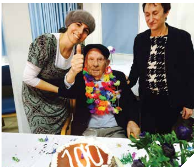
יום הולדת 100 שמח

עיריית רמלה עושה כל שביכולתה כדי לאפשר לתושבי העיר לחיות בכבוד ובאיכות חיים. הדאגה לאוכלוסייה במצוקה ובסיכון היא ערך עליון בקביעת אופייה המוסרי והערכי של קהילה. משפחות ופרטים בעיר יכולים להסתייע בשורה של פרויקטים ופעילויות תמיכה, טיפול, הדרכה ועזרה למשפחות וליחידים. המחלקה לשירותים החברתיים מפעילה מרכזים טיפוליים רבים וצוותים מקצועיים שמטרתם לאתר, לזהות, ללוות ולסייע לתושבים נזקקים, בוגרים וקטינים. מחלקת הרווחה והשירותים החברתיים נותנת שירותים מגוונים וחשובים לכ-6,300 בתי אב בעיר. טל. 08-9771610/1