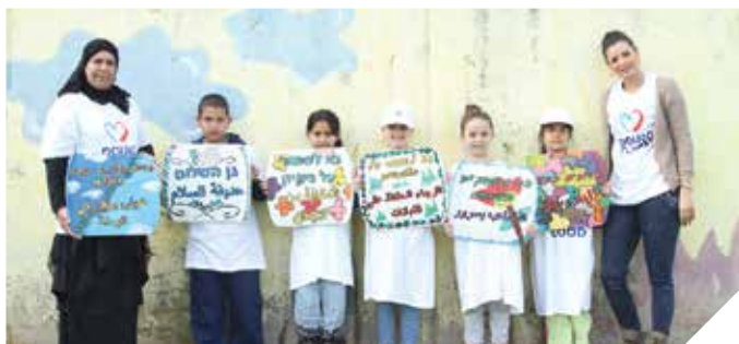
מלמדים לאהבת הסביבה

השקו את הגינות בשעות הערב רצצו את הרכב עם דלי וסמרטוט במקום בצינור התקינו חסכמים הצטברות של מקווי מים עקב דליפת דוודים או הצפת מקלטים מהווה מקור לדגירת יתושים. אנא, היו ערניים לנושא.