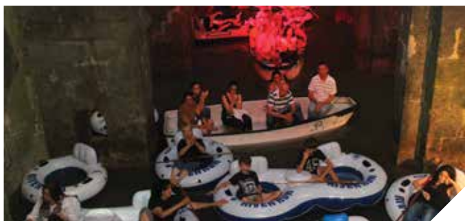
אתר טרקציה ושייט מתחת לאדמה בריכת הקשתות

לעיר רמלה יש היסטוריה עתיקה ומפוארת. כעיר עתיקה נשתמרו בה שכיות חמדה בעלות ערך ארכיאולוגי, היסטורי ותיירותי, המלמדות על מעמדה החשוב בימי קדם. אתריה המרכזיים וההיסטוריים מהווים אבן שואבת לאלפי מטיילים, חוקרים והיסטוריונים לאורך הדורות. עיריית רמלה רואה חשיבות רבה בקידום התיירות לעיר, לאתריה ולשווקיה. במהלך השנה שחלפה ביקרו באתרי העיר אלפי מטיילים.