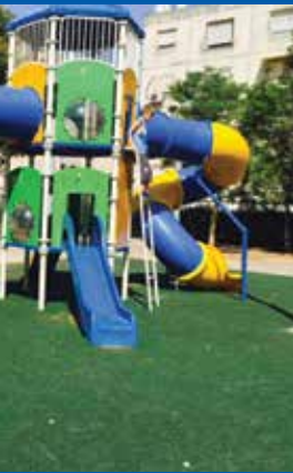
מתקני משחק חדשים, גן בן גוריון