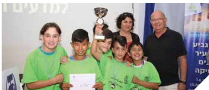
תלמידי אופק. מקום ראשון בארץ ברובוטיקה

עריית רמלה הציבה בראש סדר העדיפויות את ההשקעה בתחום החינוך. תושבי העיר ותלמידיה נהנים ממערכת חינוך איכותית, מתוכניות למידה חדשניות, מבתי ספר ממוחשבים ומחינוך שווינוי ומתקדם הפותח חלון הזדמנויות להצלחה עבור כל תלמיד. מערכת החינוך ברמלה המשיכה גם השנה ברוח הישגי פרס החינוך הארצי שניתן לעיר על גילוי מצוינות בחינוך על כל שלביו בגני הילדים, בבתי הספר ובמתנ"סים, תוך חיבורים ורצף בין החינוך הפורמאלי לחינוך הבלתי פורמאלי, לרבות החינוך המיוחד. שנה של שיפור הישגים חינוכיים ולימודיים, מניעת נשירה, צמצום פערים בחינוך, פיתוח החינוך המדעי טכנולוגי, רובוטיקה, קידום תלמידים בעלי צרכים מיוחדים, הקמת סביבות חינוכיות ולימודיות מתקדמות ופיתוח מנהיגות חינוכית מקומית.