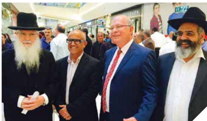
משדרגים את שירותי הדת

העירייה בשיתוף המועצה הדתית רואה במתן שירותי דת בעיר חשיבות רבה, במהלך שנת 2015 ביצעה העירייה באמצעות המועצה הדתית והמדור לתרבות תורנית בעירייה, שורה של פעולות לרווחת תושבי העיר בתחומים שונים בהם: הרצאות, סיורים, פעולות בחגים, מקוואות, שיפוץ בתי כנסת, הרחבת בית העלמין ועוד.