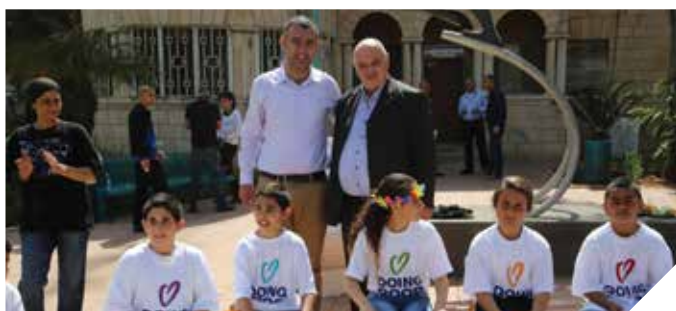
פעילות תרבות ענפה

פעמיים בחודש מגיעים לספרייה סופרים, מוסיקאים ושחקנים מן השורה הראשונה, שמרתקים ומעשירים את המשתתפים בעשייה בתרבות הישראלית במיטבה על שירה, כתיבה וספרות.