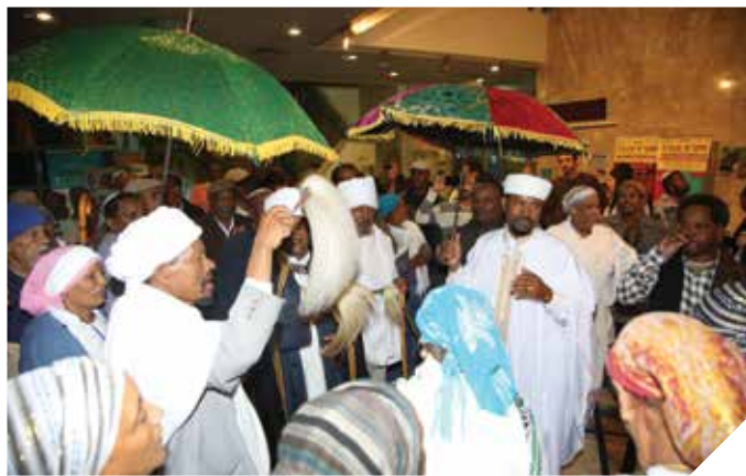
שומרים על המסורת. 2. עולי אתיופיה

מחלקת הקליטה מצויה בקשר רציף עם נציגי העלייה בסוכנות היהודית בארץ ובחו"ל לשווק את העיר באמצעות ירידים, חוברות, פליירים ומצגות.