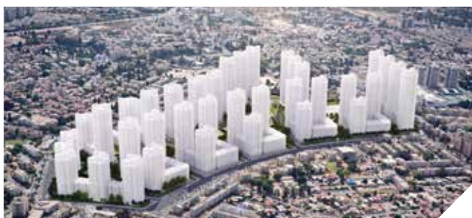
ההתחדשות העירונית. מחדשים את פני העיר