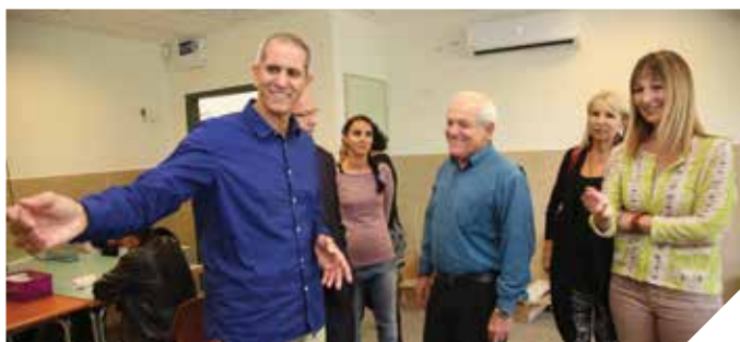
מסייעים לבעלי צרכים מיוחדים. עם שר הרווחה חיים כץ

לאנשים עם מוגבלות שכלית התפתחותית. תכנית המופעלת ע"י עובדים סוציאליים בצוות נכויות. זוהי רשת ביטחון לעשר משפחות בהן בן משפחה בגיר הסובל ממוגבלות שכלית התפתחותית, במימון משרד הרווחה. התוכנית מספקת מענה טיפולי והדרכה בנושא כישורי חיים. הפנייה דרך העו"ס המטפל. כניסה לתוכנית ע"פ קריטריונים ותלוי תקציב של משרד הרווחה.