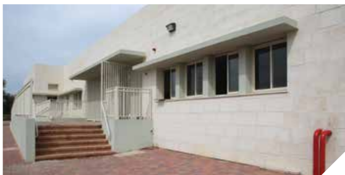
מרכז רב נכותי לאוכלוסיית בעלי הצרכים המיוחדים

נפתח המרכז הרב נכותי המעניק שירות מקצועי לאוכלוסיית בעלי הצרכים המיוחדים ברמלה והאזור. הנהלת העירייה מאמינה, כי הדאגה לאוכלוסייה עם צרכים מיוחדים היא ערך עליון בקביעת אופייה המוסרי והערכי של הקהילה, תוך מתן הזדמנות שווה לכל בן אנוש לחיות בכבוד ובאיכות חיים.