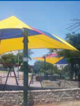
הצללות בגני המשחקים