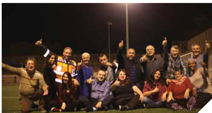
מתנדבים במסירות ואהבה