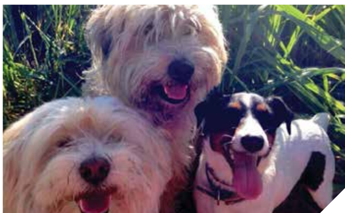
מקס, רגע וצמר. לקוחות מרוצים

השירות הוטרינרי העירוני מפקח ומבקר את איכות המזון ומצב התברואה בעסקים באמצעות עריכת בדיקות טרום שיווק למזון הנכנס לעיר ועריכת מאות ביקורות תברואה בעסקי המזון כל זאת במטרה למנוע שיווק של מוצרי מזון מן החי, שאינם ראויים למאכל אדם. בשירות הוטרינרי ניתן ייעוץ לבעלי עסקי מזון, לשם קידום המקצועי ותיקון ליקויים שנמצאו בביקורות התברואיות.