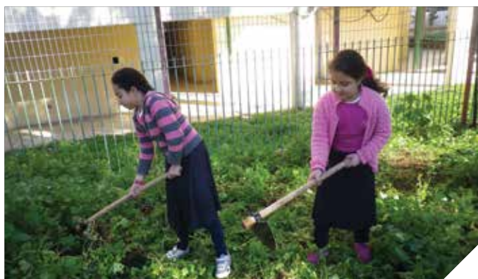
מטפחים את הגינה

תיכון אורט רמלה-לוד ערבי קיבל הסמכה לבי"ס ירוק. וגן רעות קיבל תו גן ירוק. בכך הצטרף לתיכון אורט ללילינטל, אופק ובן גוריון ולשמונה גני ילדים שכבר הוסמכו בעבר. סניף בני עקיבא קיבל תו ירוק זו השנה השנייה על פעילות סביבתית.