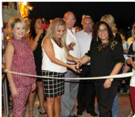
חונכים את בית ספר ביסטריצקי למדעים ואומנויות