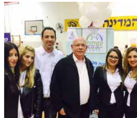
קשתות. מקדמים יריד תעסוקה

שונים ברשויות המקומיות ובשירות המדינה. עשרות השתתפו בימי גיוס ממוקדי אוכלוסייה: סטודנטים/אקדמאים ועוד בתחומים שונים: ריכוז, הדרכה, שירות לקוחות, מכירה ועוד.