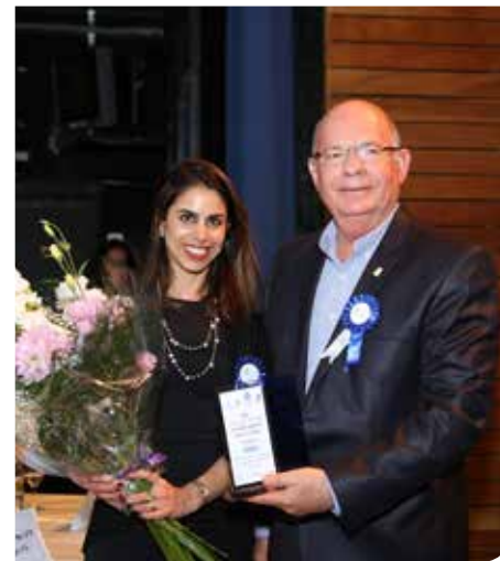
פרס את קהילה מתנדבת