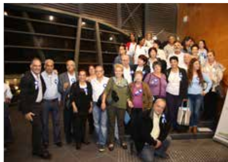
רמלה. מודל ארצי להתנדבות

אפיקים. תוכנית להכנה לשוק העבודה לצעירים הנזקקים להכנה, העצמה, השלמת השכלה וליווי אישי לצורך קליטה בשוק העבודה. כ-20 צעירים השתתפו השנה בתוכנית, המופעלת בשיתוף מרכז קשתות.