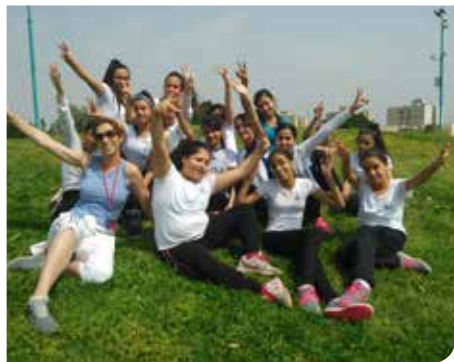
כדורסל בנות. אתנחתא, גביע ראש

כנס רמלה. הכנס "בן ישראל לעמים" התקיים באשכול פיס באסרו חג של פסח בהשתתפות שרים חברי כנסת רבנים ואישי ציבור.