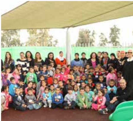
גן יהודי גן ערבי

ילדי המועדוניות מגיעים לספרייה מדי שבוע מכל שכבות הגיל, לפעילות שעות פנאי, החלפת ספרים, משחקיה ופעילות העשרה. לכל ילדי המועדוניות הוענקו מנויים בספרייה.