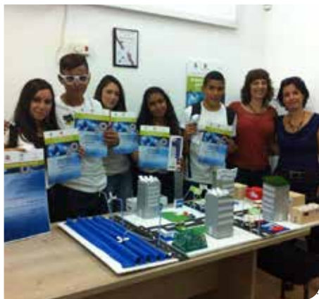
מפתחים גם תעשייה ירוקה

חדשים, במיוחד בשכונת קרית מנחם בגין ובמוסדות החינוך. הגנים הציבוריים שרת, תמרי ברחוב השריון וגן השלום עברו מתיחת פנים לרבות שדרוג מתקני המשחק, שתילת שיחים ועצים, שבילים ועוד. בכל הגנים הציבוריים בעיר הוצבו מתקנים לאיסוף צואת כלבים, אשפתונים וספסלים.