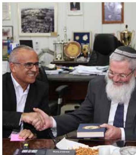
מקדמים את שירותי הדת