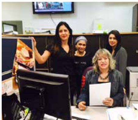
למען מימון סל שירותים מגוון ומקצועי

המחלקה אחראית על מתן שירותי המחשוב לכל מחלקות העירייה, לרבות מוסדות החינוך הרשמיים והלא רשמיים בעיר, בתי הספר וגנ"י המשרתים את אוכלוסיית העיר. שירותי המחשוב ניתנים החל משלב ניתוח צורכי המחשוב ומתן פתרונות אינטגרטיביים כוללים, הן מבחינת חומרה/תוכנה/תקשורת אינטגרציה, הפעלה והטמעה של ממשקי המערכת ועוד.