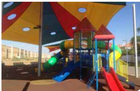
בונים פארקים ומתקני משחקים

כדי לקדם ולזרז בניית תשתיות בשכונות העיר יזמה הנהלת העיר העברת תקציבי פיתוח ממשרד הבינוי לעירייה. בימים אלה פועלת העירייה להשלמת תשתיות הפיתוח בשכונת קריית האומנים. העבודות כוללות: השלמת מדרכות, קרצוף וריבוד כבישים, סלילת רחובות, פיתוח פארקים והשלמת העבודות לפתיחת כביש הכנסה מפיקוד העורף.