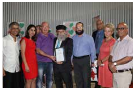
יד ביד למען תושבי העיר

שירותים מיוחדים כגון השמות במסגרות של דיור מוגן, בתעסוקה מוגנת ונתמכת, במרכזי יום סיעודיים טיפוליים, במעונות יום שיקומיים, במועדונים חברתיים, במסגרות יום ארוך לילדים הזכאים לכך באשכול גנים לימן ובבית ספר יובלים ובי"ס סיני ועוד. כמו כן מתן שרותי סיוע של סיעות שילוב במעונות, הדרכה שיקומית לעיור, ייעוץ והדרכה פרטנית וקבוצתית, הפניות למכוני ייעוץ וגורמי סיוע בקהילה, פיתוח שירותים לנכים במשותף עם קרן שלם והמוסד לביטוח לאומי וימי הסברה. רכזת מש"ה (מוגבלות שכלית התפתחותית) 08-9771623, רכזת שיקום ואוטיזם- 08-9771808.