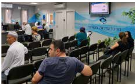
ת.מר שרות יעיל סביב השעון