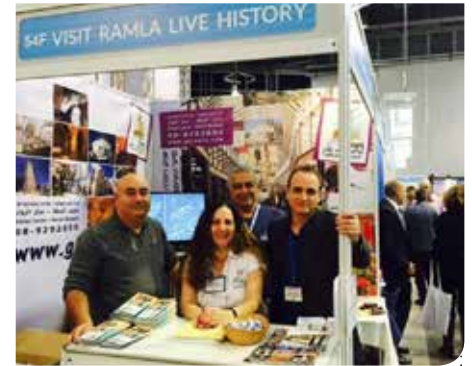
מקדמים את התיירות

הצלחה לביתן העיר רמלה ביריד התיירות הבינלאומי. לראשונה נטלה רמלה חלק ביריד התיירות הבינלאומי השנתי. גורמי תיירות בישראל הביעו עניין רב באתריה ההיסטורים של העיר ובמה שיש לרמלה להציע לקבוצות, משפחות ומטיילים.