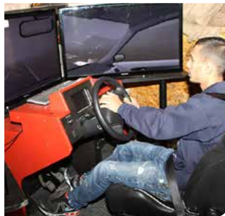
סימולטור ללימוד נהיגה

כמיטב המסורת קיים המטה חידון עירוני לתלמידי בתי הספר התיכוניים בנושא נהיגה נכונה. התלמיד שהעפיל למקום הראשון, זכה בפרס מימון שיעורי נהיגה.