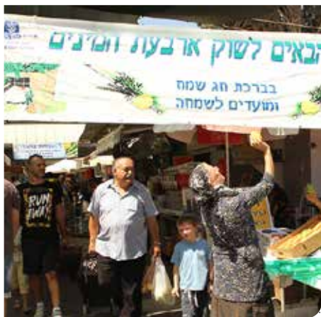
שוק ארבעת המינים