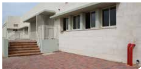
מבנה טיפולי חדשני ומודרני