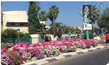
מפתחים את הגיזון