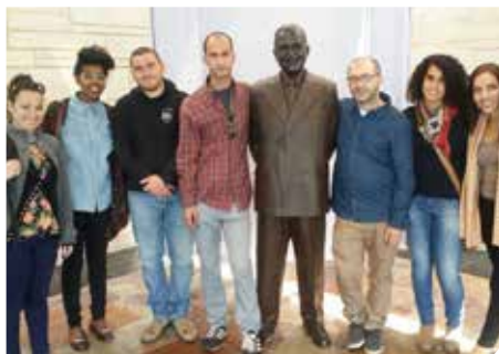
צעירי קשתות בשליחות קנדס סיטי