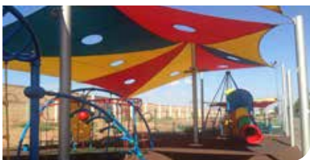
משחקי גן לרווחת הילדים