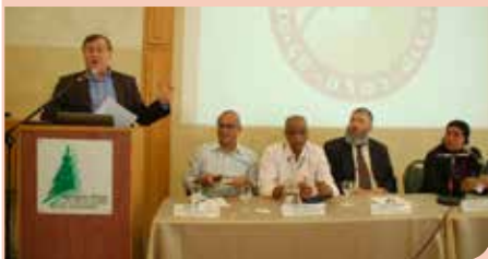
יוצרים דיאלוג רב תרבותי

מרכז גישור ויישוב סכסוכים בקהילה - רמלה, הוקם במטרה ליצור תהליך שינוי חברתי ברמה עירונית צמצום הקונפליקטים בחברה, תוך יצירת דיאלוג בקרב התושבים על ידי פעולות גישור, הסברה ומניעה. במהלך 2014, הופנו למרכז למעלה מ-131 פניות כשמתוכם 45 פניות מתוך הקהילה, שה"כ נהנו מקבלת שרות זה כ-280 איש באופן ישיר וכ-50 איש באופן עקיף. בין היתר עוסקים במרכז הגישור בבניית הסכמות לוועדי בתים ובעלי עסקים, הכשרות וקורסי גישור - 256 תושבים סיימו קורס גישור וחלקם מתנדבים במסגרת המרכז, (17 קורסי גישור), "פרקטיקום" - התנסות מודרכת בגישור בתחום הקהילה התקיימו 4 קורסים, מנהיגות מגשרת ודיאלוג אחר בבתי הספר.