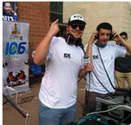
שידורים ישירים מהשטח

רדיו קול רמלה 106 FM, רדיו חינוכי קהילתי של קול ישראל ברמלה, משדר מדי יום לרחבי העיר רמלה והסביבה. בתחנה אולפן רדיו חדיש, אולפן לימודי, תקליטייה וחדר הפקה.