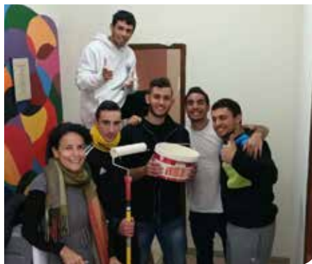
מועצת נוער פעילה

בחודש יולי השנה נפתחה 'עיר הנוער' במתחם פארק עופר והתקיימו בה פעילויות ומופעים לבני הנוער, מסיבות אוזניות, תחרויות ספורט לקבוצות וליחידים, והכול בניהולם ובהשגחתם של אנשי מקצוע.