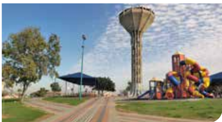
פארקים ופונות משחק