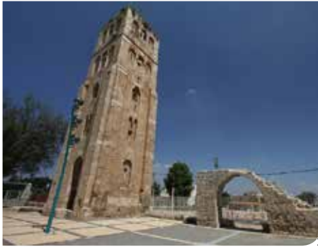
מטפסים על מגדל בן 700 שנה