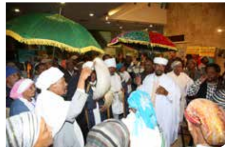
מחבקים את הקהילה האתיופית

בשנת 2014 הגיעו לרמלה כ-50 עולים צעירים, אקדמאים במסגרת תוכנית "אולפן עציון". הצעירים, בגילאים 22-35, בעלי השכלה גבוהה, עלו מארצות שונות כגון איטליה, צרפת, הונגריה, ארצות הברית, דרום אמריקה, רוסיה ואוקראינה. הם התגוררו במעונות ייעודיים ולמדו עברית במשך 5 חודשים באולפן מותאם ומיוחד. הסטודנטים השתתפו בפעילויות חברתיות ותרבותיות להכרת הארץ והחיים בישראל. כ-10 מתוכם נשארו לגור ולהשתקע בעיר לאחר שהבינו את הפוטנציאל הטמון בה בין היתר בשל קרבתה למרכז הארץ ומחירי המחייה הנמוכים.