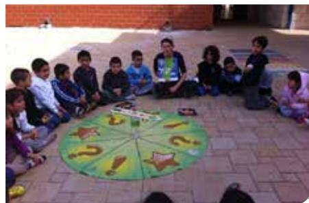
פעילות קק"ל לשמירה על הטבע