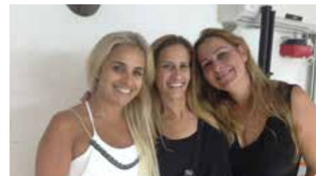
פותחים חלון להצלחה לכל תלמיד

"מועדון הטייסת" היא תוכנית מצוינות לילדי כיתות ה' - ו' בשיתוף חיל האוויר, משרד החינוך והתאחדות התעופה האזרחית. בראש הפרויקט נשיאת קרן רמון, הגב' רונה רמון. הפרויקט פועל בשיתוף בסיס חיל האוויר תל נוף. מטרת הפרויקט היא לפתח מנהיגות חברתית-ערכית. מועדון הטייסת מעמיד לרשות התלמידים מאמן המשמש "בוגר משמעותי" המלווה את הפרט ואת הקבוצה. כל זאת בשיתוף צוות בית הספר ומשפחות התלמידים הנבחרים. הפרויקט פועל בבתי הספר מענית ואופק.