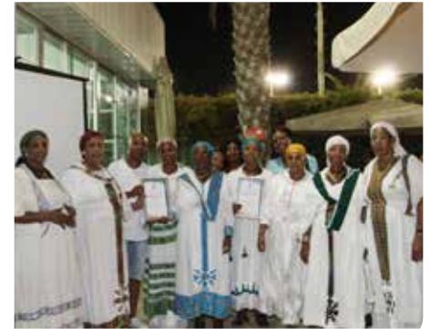
מסייעים ותומכים בקהילה

לאנשים עם מוגבלות שכלית התפתחותית. תכנית המופעלת ע"י עובדים סוציאליים בצוות נכויות. זוהי רשת ביטחון לעשר משפחות בהן בן משפחה בגיר הסובל ממוגבלות שכלית התפתחותית. כניסה לתוכנית ע"פ קריטריונים ותלוי תקציב של משרד הרווחה.