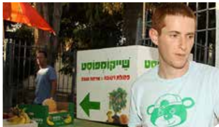
מקדמים את המחזור

מתנדבים פעילים למען הסיביבה הוסמכו כ"נאמני סיביבה" ומקדמים פרויקטים בעיר, בעיקר בתחום המחזור והניקיון. הקבוצה מזמינה תושבים נוספים להצטרף. קבוצת מנהיגים קהילתיים ערבים מתנדבים, פועלת גם בתחום איכות הסיביבה, לקידום מודעות מחזור בקרב התושבים, מעורבות בני נוער, טיפוח סיביבה ועוד.