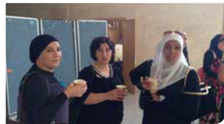
מחנכים לדו קיום

דוקיום. מערכת החינוך ברמלה משקפת ומעודדת את הדו-קיום בעיר רבת תרבותית: מנהלי בתי הספר בעיר, יהודים וערבים, משתתפים בהשתלמות "חיים משותפים"; הפעלת תוכנית "בואו נדבר" ללימוד ערבית בבתי הספר היהודיים; שילוב תוכנית "מפתח הלב" ו"חיים משותפים" יחד, בהובלת הרכוזות החברתיות; צמדי בתי ספר יהודים וערבים, חילוניים ודתיים, יוצרים שיתופי פעולה ייחודיים.