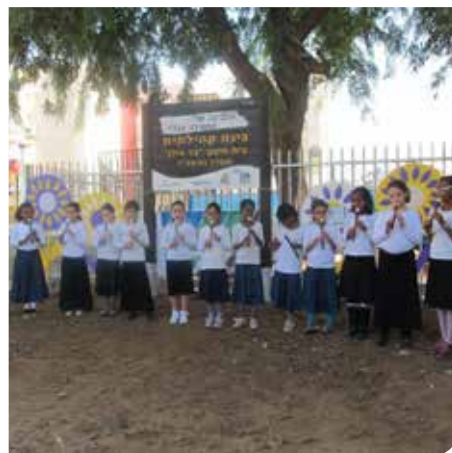
מטפחים גינות ירוקות

בבית ספר יובלים פועלת סדנא בה התלמידים מפרקים מחשבים ישנים ומכשירים האלקטרוניים למרכיבים ברי מחזור. בזכות פעולתם, הועברו למחזור למעלה מ-15 טון פסולת אלקטרונית למחזור. העירייה הקימה מרכז לאיסוף פסולת אלקטרונית במחסן העירייה, ברחוב הגדוד העברי, לרווחת התושבים, הפסולת מועברת למחזור.