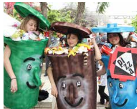
שומרים על הסיביבה

סיוע רב התקבל מתלמידי מגמת איכות הסביבה של תיכון אורט רמלה לוד ערבי, שבצעו בהתנדבות את ההסברה בבתי התושבים בשכונות ג'זאריש וגן חקאל. מצטיינים במיוחד באיכות הפרדה, תלמידי בתי הספר היסודיים, שמפרידים את הפסולת הרטובה, לאחר ארוחת הצהריים בכיתות.