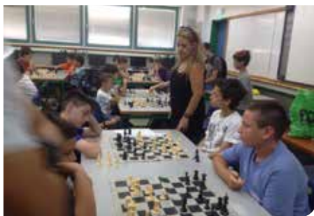
לומדים וחושבים שחמט

הערייה משקיעה משאבים רבים בקידום מערכת החינוך. כשליש מתקציבה של הערייה כ-123 מיליון שקלים מופנים לטובת מערכת החינוך העירונית. במערכת החינוך העירונית לומדים כ-17,693 תלמידים* בעיר 24 בתי ספר יסודיים* 17 מוסדות חינוך על יסודיים* 2 בתי ספר לחינוך מיוחד* 133 גני ילדים