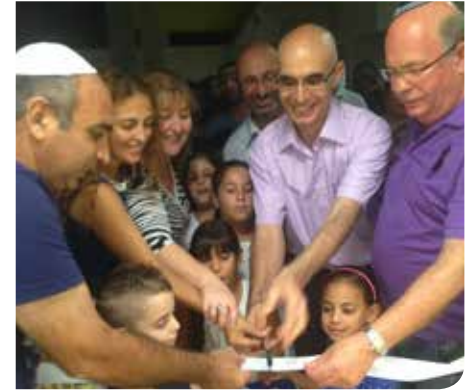
חונכים את בית הספר היסודי קשת

מתחדשים. בשנה שחלפה הוקמו ונפתחו שני בתי ספר חדשים בשכונת קריית האומנים על מנת לתת מענה לאוכלוסייה הגדלה וצומחת: ביה"ס הגש שנתי "אורט למדעים ואומניות על שם זאב ביסטריצקי" - ביה"ס צומח שבשנה"ל תשע"ה לומדים בו תלמידים בשכבות ז'-י' וביה"ס יסודי צומח "קשת" בו לומדים בשנה"ל תשע"ה תלמידים בשכבות הגיל א-ג.