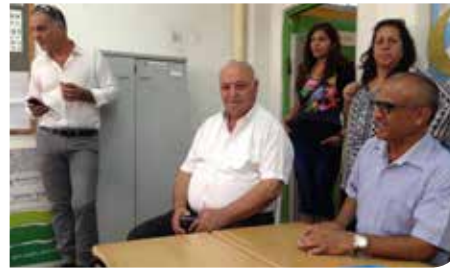
משקיעים יותר. בחינוך

מרתקות ולעולמות למידה ויצירה חדשים באופן המעורר סקרנות ויוצר התחדשות ואתגר. חשיפה זו להעשרה כה מגוונת מאפשרת לילדים להביא לידי ביטוי יכולות וכישורים בפריסה רחבה של תחומים, כדוגמת אמנות פלסטית, טבע וסביבה, תיאטרון ודרמה, מחול ותנועה, מוסיקה, פיתוח חשיבה, מדע וטכנולוגיה, מחשבים, אוריינות, חברה ותרבות, צילום ותקשורת, ספורט, כישורי חיים, אלטרנטיבי, עם וארץ ישראל ועוד. בשנה"ל תשע"ה הורחבה התכנית לשני בתי ספר נוספים.