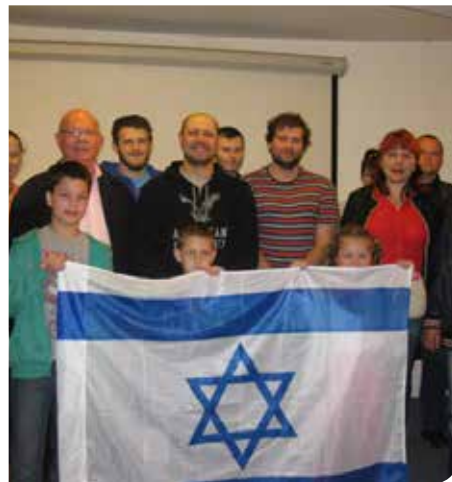
קולטים את הקהילה מאוקראינה

הופעלו מועדוני עולים לגילאים שונים בשפות שונות, סדנאות מגוונות בפסיכודרמה, מנהיגות וגישור קהילתי, חוגי התעמלות, חגיגת חגי ישראל, ערבי קולנוע, סיורי מורשת להכרת הארץ וההיסטוריה בהשתתפות מאות עולים, סדנאות לשעת חירום ועוד.