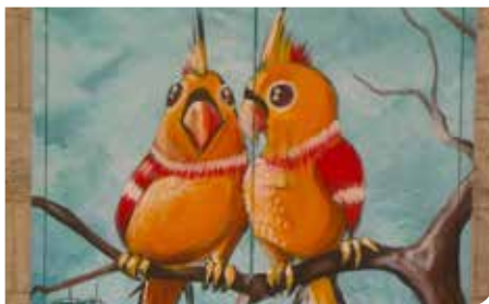
משפרים את חזות העיר

השקו את הגינות בשעות הערב רחצו את הרכב עם דלי וסמרטוט במקום בצינור התקינו חסכמים הצטברות של מקווים מים עקב דליפת דוודים או הצפת מקלטים מהווה מקור לדגירת יתושים. אנא, היו ערניים לנושא.