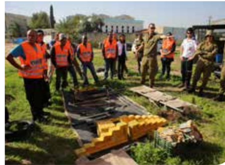
צוות חילוץ והצלה

כחלק מהעבודה השוטפת, מחלקת הביטחון שומרת על כשירות גבוהה של אורגני וגורמי העירייה במוכנותם לחירום. ככלל שנה, מרועננים כלל תיקי תכנון החירום של המחלקות ברשות.