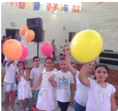
פותחים שנה בקשת