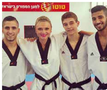
אלופי המדינה בטקוואנדו

מרכז הטניס רמלה זכה גם השנה בגביע המדינה, בפעם ה-12. זאת בנוסף ל-16 אלפיות מדינה. במרכז לומדים למעלה מ-400 ילדים ובני נוער הגורפים פרסים ומקומות ראשונים בתחרויות ארציות מובילות.