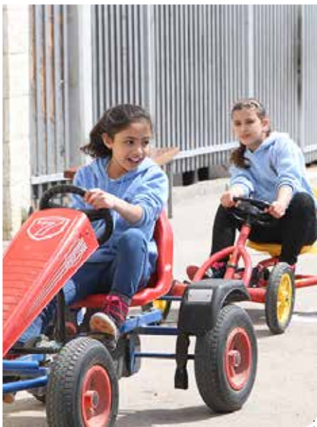
לומדים רכיבה בטוחה

יום המחויבות הארצי לבטיחות בדרכים התקיים השנה ברחבי העיר, בין היתר בשוק העירוני ובקניון קרית הממשלה. הפעילות התבצעה בסימן הולכי רגל, חצייה בטוחה ופנייה לנהגים להאט מהירות נסיעתם.