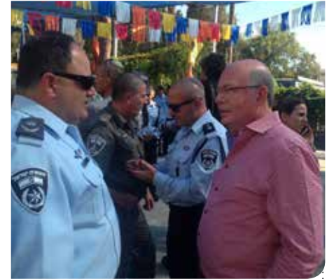
משדרגים את הביטחון

מחלקת הביטחון הישראלית היא נושאת הדגל בין רשויות האזור בכל תחומי הביטחון והמוכנות לחירום ומשמשת מודל לחיקוי במספר רב של רשויות. המחלקה משקיעה מאמצים וכספים רבים לשיפור תחושת הביטחון של התושבים והיערכות לחירום. ולמענה יעיל וזמין יותר.