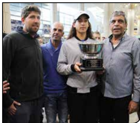
עולילא. אלוף עולם בטניס לגילאי 14

עיריית רמלה מעודדת אורח חיים בריא וספורטיבי. מטרתה להמשיך ולטפח את הספורטאים, לשדרג את מרכזי הספורט בעיר ולקרב את האוכלוסייה לחיות בריא ולהיות פעילים יותר. בשנת 2014 המשיכה העירייה להפעיל בתי ספר בענפי הספורט השונים, תוך טיפוח ספורטאים מצטיינים. השנה יצא לדרכו פרויקט "פרחי ספורט" בבתי הספר, בנוסף לפרויקט "זוזו" שפועל זו השנה החמישית. תלמידי בתי הספר היסודי בעיר זוכים לקבל שעת חנ"ג נוספת במערכת השעות. פעילות הספורט בעיר ממשיכה לצמוח תוך קיום שורה ארוכה של אירועים עממיים ותחרותיים, לצד מאמנים מקצועיים שחקני נבחרות ישראל בכל ענפי הספורט.