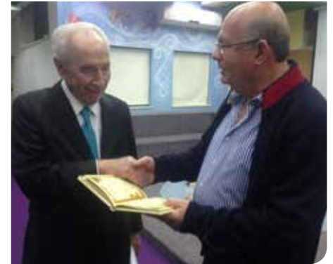
ביקור נשיאותי בספרייה

שבוע הספר "חודש קריאה" נפתח מדי שנה ברחבת הספרייה בנושא הפנינג - "גיבורי הספרים הנפלאים" הדמויות מספרי המופת של ילדותנו קמות לתחייה: הסנדלר והגמדים, עוץ לי גוץ לי, באר המשאלות של שלגיה, רובין הוד, בת הים הקטנה, המלך ארתור ועוד. סדנאות יצירה והצגות ילדים, דוכני מכירת ספרים, ומופע מסכם גדול "שני פסנתרים וגיטרה" שלומי שכן מארח את שלומי גרוניך ורונה קינן - מופע קיץ לא סטנדרטי.