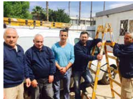
משפצים ומשדרגים באהבה

באחריות היחידה מתן מענה שוטף לנושאי אחזקה בעירייה בכלל ובמערכת החינוך בפרט. בין הנושאים המטופלים על ידי היחידה: טיפול בנושאי חשמל, טיפול במערכות מים במוסדות החינוך, טיפולי נגרות כלליים, טיפול בליקויי בטיחות, שיפוץ וצביעת מוסדות החינוך ועוד.