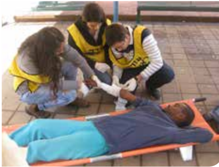
נערכים לחירום בבתי הספר

עיריית רמלה, בשיתוף פיקוד העורף, רשות חירום לאומי וגורמי החירום ביצעה במהלך 2014 שורה של תרגילי חירום וקיום השתלמויות מקצועיות לעוסקים בחירום. מכלולי העירייה עברו בהצלחה רבה ביקורת מיוחדת שבוצעה ע"י גורמי משרד הפנים, פיקוד העורף, ראשות חירום לאומית ומשטרת ישראל.