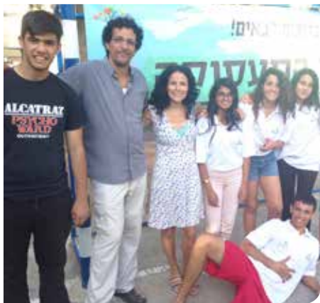
מקדמים תעסוקה לבני הנוער

חברי מועצת הנוער העירונית לקחו חלק פעיל בלימוד רזי עולם הרדיו והטלוויזיה והיו חלק בלתי נפרד ממרכז התקשורת העירוני המאפשר התנסות אמיתית בעולם התקשורת.