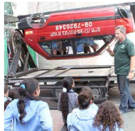
לומדים במרכז ההדרכה

במרכז יום לקשיש בודד רזיאל הועברו הרצאות על התנהגות נכונה בירידה מן האוטובוס ובחציה בטוחה בשעות החשכה. בחודש מרץ הופעלו סדנאות "כישורי חיים בדרך" בהתאם לשכבות הגיל, בבתי הספר "בר אילן" ו"בן צבי". כן התקיימו סדנאות בבי"ס "עמל טכנולוגי" המאפשרות ללומדים ל"צרו" במוח ידע על מצבים מסוכנים שיאפשר לכל לומד להשתמש במידע קודם, לשלוף אותו אינטואיטיבית ולהשתמש בו במקרה אמת והכול באופן חוויתי. התקיימה הרצאה לרכזי בטיחות של בתי הספר, בנושא אופניים חשמליים. כן מתקיים פרויקט "נשק וסע" שהורחב לבתי ספר נוספים בעיר בהם, ביה"ס "קשת" החדש בקרית האומנים, ביה"ס "אופק" בקרית מנחם בגין ובי"ס "אחוה".