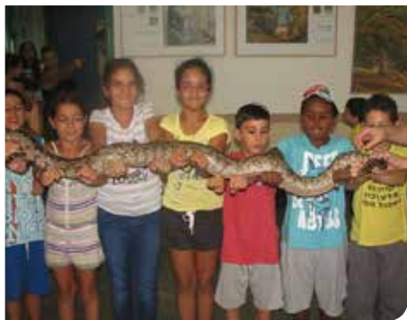
העשרה לעולם הטבע