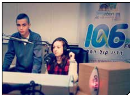
מתנדבי הרדיו בפעולה

ב-YES וב-HOT. התוכנית זכתה לביקורות מצוינות מאנשי המקצוע ומאנשי ההפקה של חברת "מכאן", האחראית על השידורים הקהילתיים בארץ. הטלוויזיה הקהילתית מזמינה את התושבים לצפות, להגיב ולקחת חלק בעשייה הטלוויזיונית הענפה.