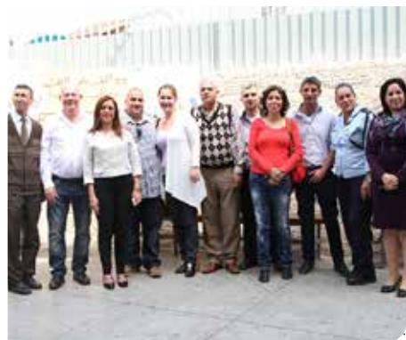
מחנכים לזהירות בדרכים

משמרות זה"ב תלמידי בתיה הספר – תוגברו מעבר החציה בכיכר רוטרי ע"י תלמידי ביה"ס "מענית ו-אריאל". בכיכר שופט בית המשפט העליון אדמונד לוי ז"ל הותקנו עיני חתול ובכל רחבי העיר, הותקן שילוט בפנייה לנהגים ולהולכי הרגל.