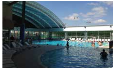
בריכת שחייה פעילה בכל ימות השנה

הושלם פרויקט חימום מי בריכת השחייה העירונית המקורה. אלפים מתושבי וילדי רמלה נהנים מבריכת שחייה מחוממת גם בחודשי החורף כזכור ביצעה העירייה קירוי מודרני לבריכה שעלותו נאמדה בכ-4.5 מיליון שקלים