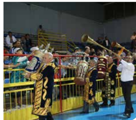
הקפות בדוד רזיאל

המועצה הדתית רמלה הייתה הראשונה בה ניתנה אפשרות לאזרח לקבל חלק מהשירותים דרך אתר האינטרנט על מנת להקל על התושבים. כך ניתן לפתוח תיקי נישואין, בירור כשרויות, שירותי קבורה, מידע על כל הפעילות התורנית בעיר, שיעורים וצרכים אחרים. באתר הותקנה מפת עירוב לשירות תושבי העיר. www.ramla.muni.il