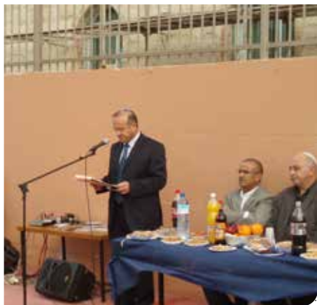
שרותי דת מתקדמים