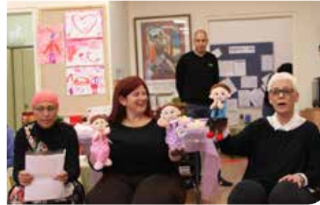
פגשים ומבשלים שלום

מידי שנה מרכזת את הפעילות הספרייה הציבורית בלפר עם גני הילדים בעיר ועם המגזר הערבי מיזם שהתחיל ביוזמת הספרייה והפך לתוכנית משרד החינוך, במסגרתה נערכת פעילות משותפת של גני הילדים בעיר. הפעילות השנתית נחתמת בטקס פתיחת תערוכה ומיזמים תלת מימד יצירותיהם של ילדי גני הילדים בעקבות הסיפורים והשירים שקראו במהלך השנה.