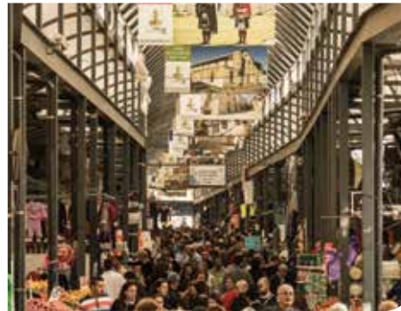
שייט בבריכה תת קרקעית בת 1,200 שנה

מי אמר שתערוכות יש רק בעיר הגדולה? סדרה של תערוכות אומנות - ציור ופיסול של אמנים רמלאים, נפתחה בגלריה שבקומה השנייה במוזיאון רמלה. עוד לא ביקרתם?