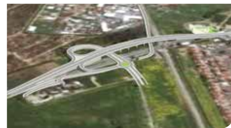
הפרדות מפלסיות בכניסה לעיר