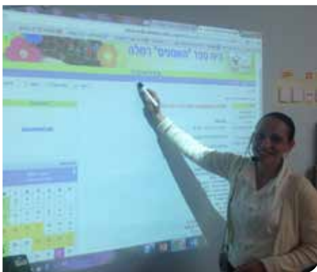
לומדים באמצעות לוח חכם