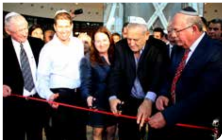
עזריאלי. מקור תעסוקה לכ-700 עובדים

קניון עזריאלי פתח שערו לאלפי תושבי רמלה והאזור. הקניון שנבנה ע"י קבוצת עזריאלי בהשקעה של 430 מיליון שקלים מכיל למעלה מ-150 חנויות מותגים, משחקייה לילדים, בתי קפה ומסעדות.