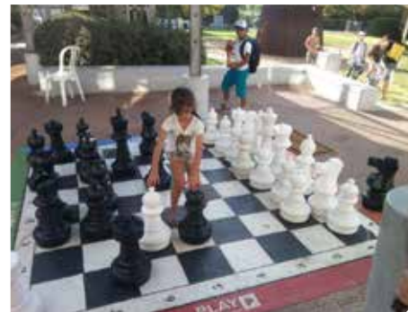
סל תרבות מגוון

במתנ"ס גרסי פועל מועדון נוער המהווה מרחב זמין עבור בני הנוער, ומשמש כמסגרת חברתית בשעות אחר הצהריים. המועדון נגיש לכלל אוכלוסיית הנוער המתגוררת באזור מתנ"ס גרסי ומאפשר הידברות וקבלת סיוע בכל פעילות חברתית, חינוכית או אחרת. במתנ"ס גרסי מתקיימים ערבים חברתיים, הקרנת סרטים אירועי חגים שונים וסדנאות. במתנ"ס קיים מתחם מיוחד לבני הנוער שכולל מתקנים לבני הנוער: סנוקר, משחקי מולטימדיה, הוקי שולחן ועוד. רחוב שרת 1, 08-9295617